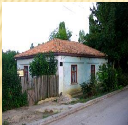
ДОМ-МУЗЕЙ ПАУСТОВСКОГО В ТАРУСЕ"