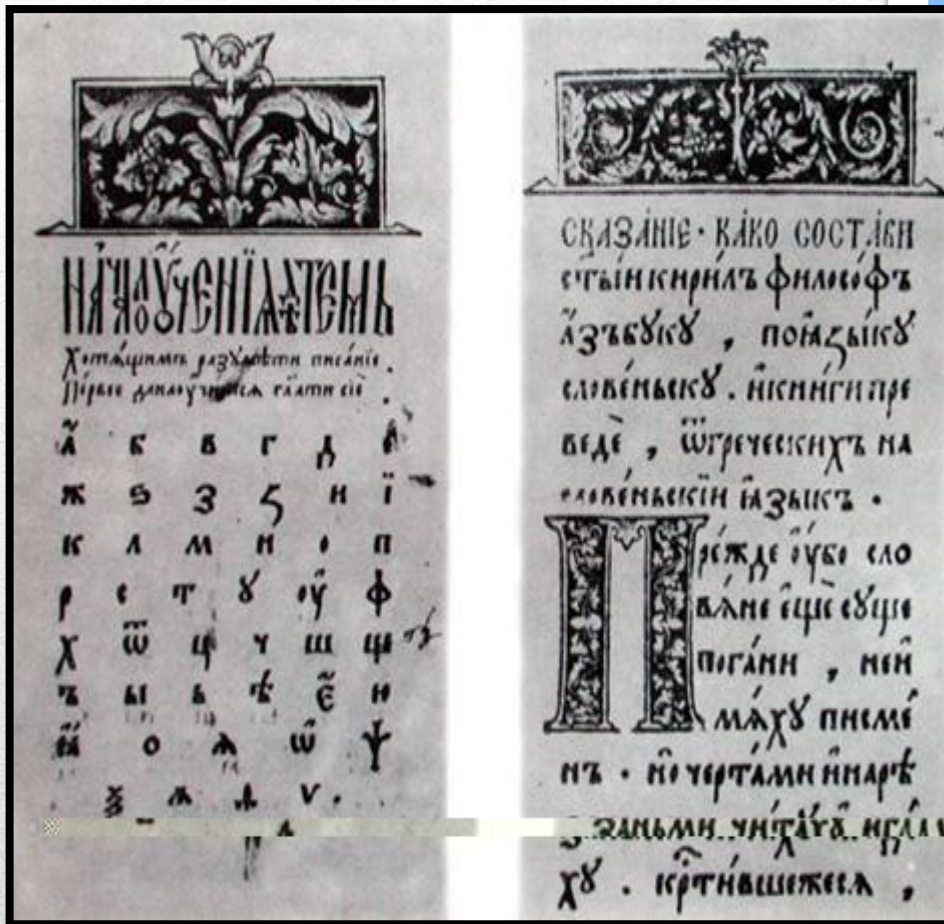
Страницы из Острожской азбуки Ивана Федорова 1578 года