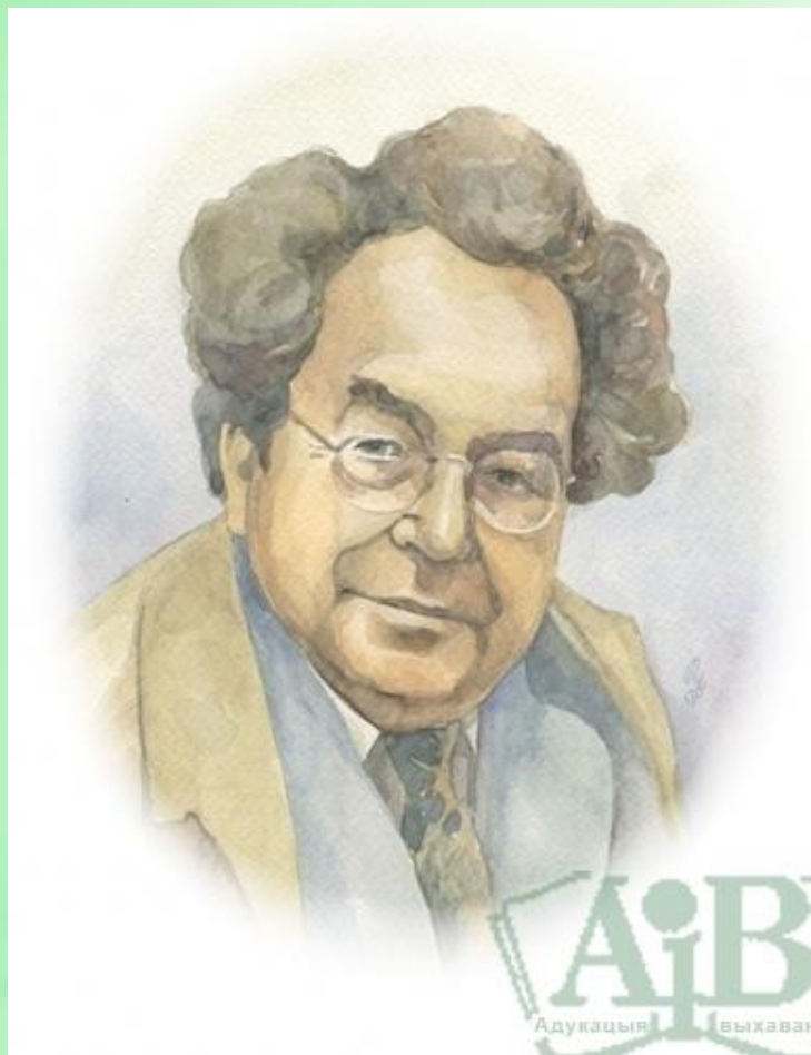
Пермяк (Виссов) Евгений Андреевич (1902 – 1982)