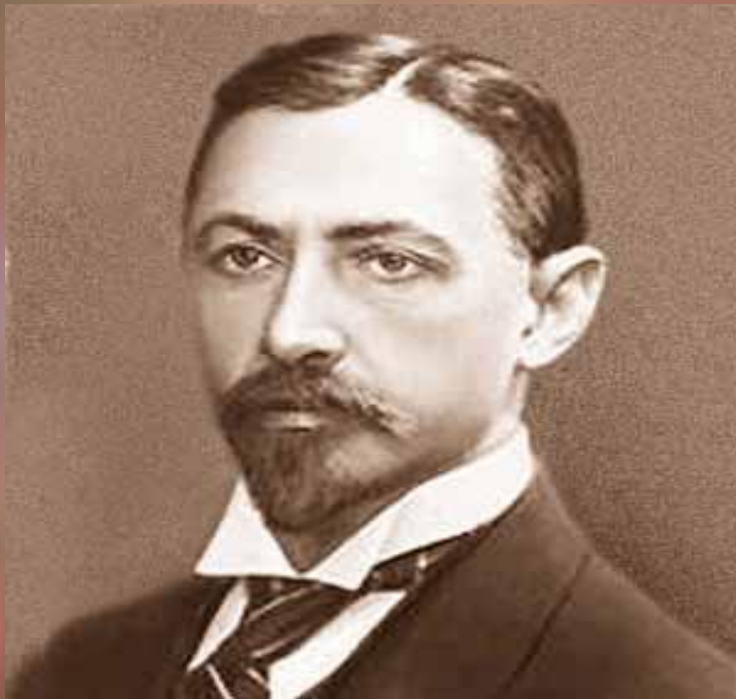
ИВАН АЛЕКСЕЕВИЧ БУНИН 10 (22) ОКТЯБРЯ 1870 Г.-8 НОЯБРЯ 1953 Г.