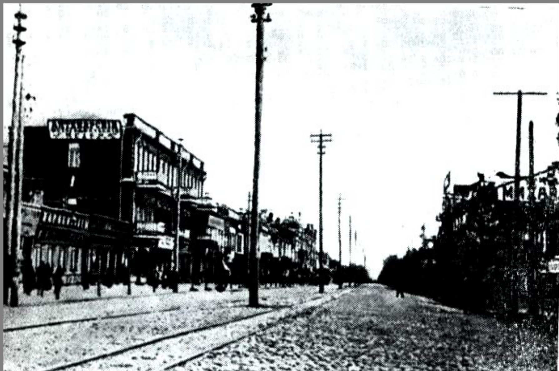
Воронеж, Большая Дворянская – на этой улице родился И.А. Бунин