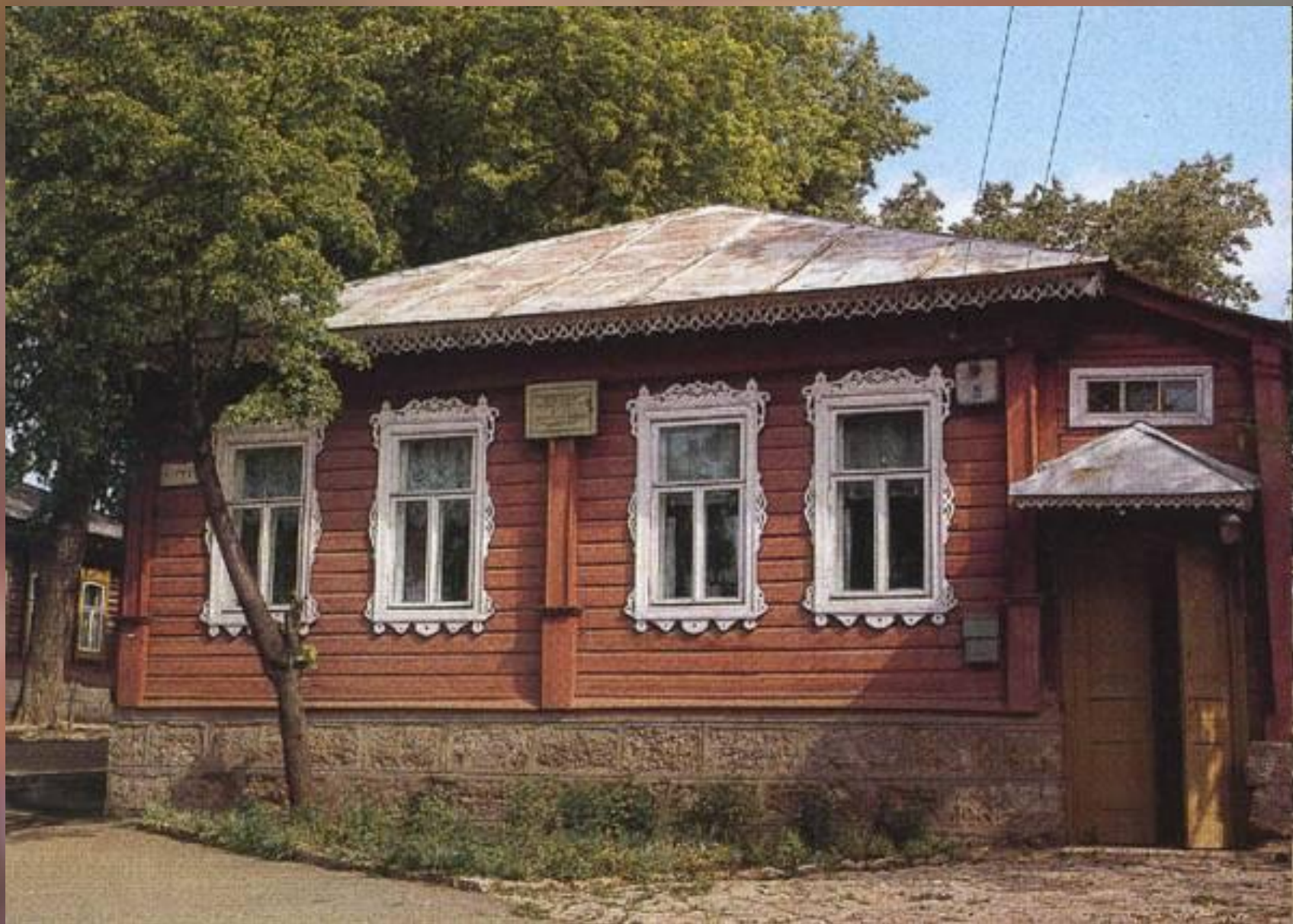
Домик-музей И.А. Бунина. г. Елец