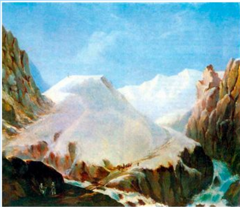
Лермонтов М. Ю. Крестовая гора, 1837