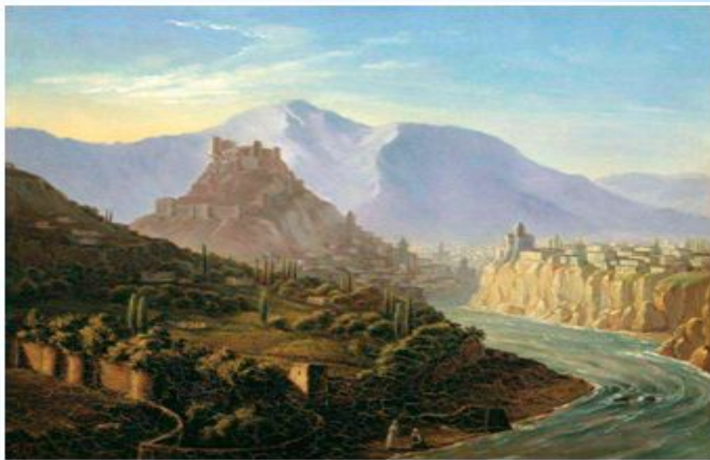
Лермонтов М. Ю. Тифлис, 1837

В ладони мерно ударяя, они поют - и бубен свой Берёт невеста молодая. И вот она, одной рукой Кружа его над головой, То вдруг помчится легче птицы, То остановится, глядит - И влажный взор её блестит Из-под завитливой ресницы.