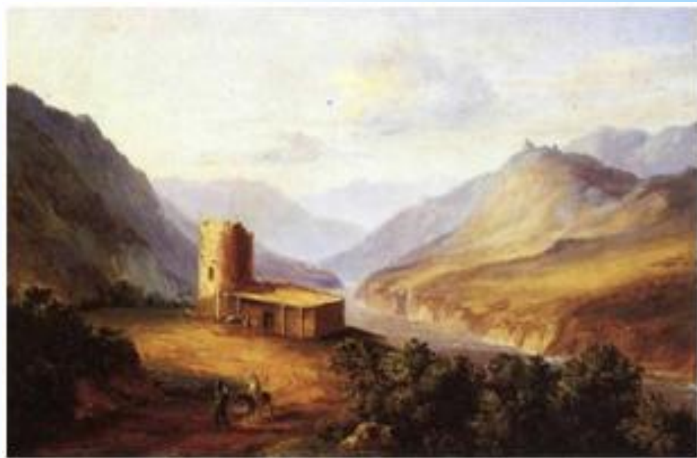
Лермонтов М. Ю. Военно-грузинская дорога близ Мцхета. (Кавказский вид с саклей), 1837

Ночевала тучка золотая На груди утеса-великана; Утром в путь она умчалась рано, По лазури весело играя; Но остался влажный след в морщине Старого утеса. Одинок Он стоит, задумался глубоко, И тихонько плачет он в пустыне. 1841