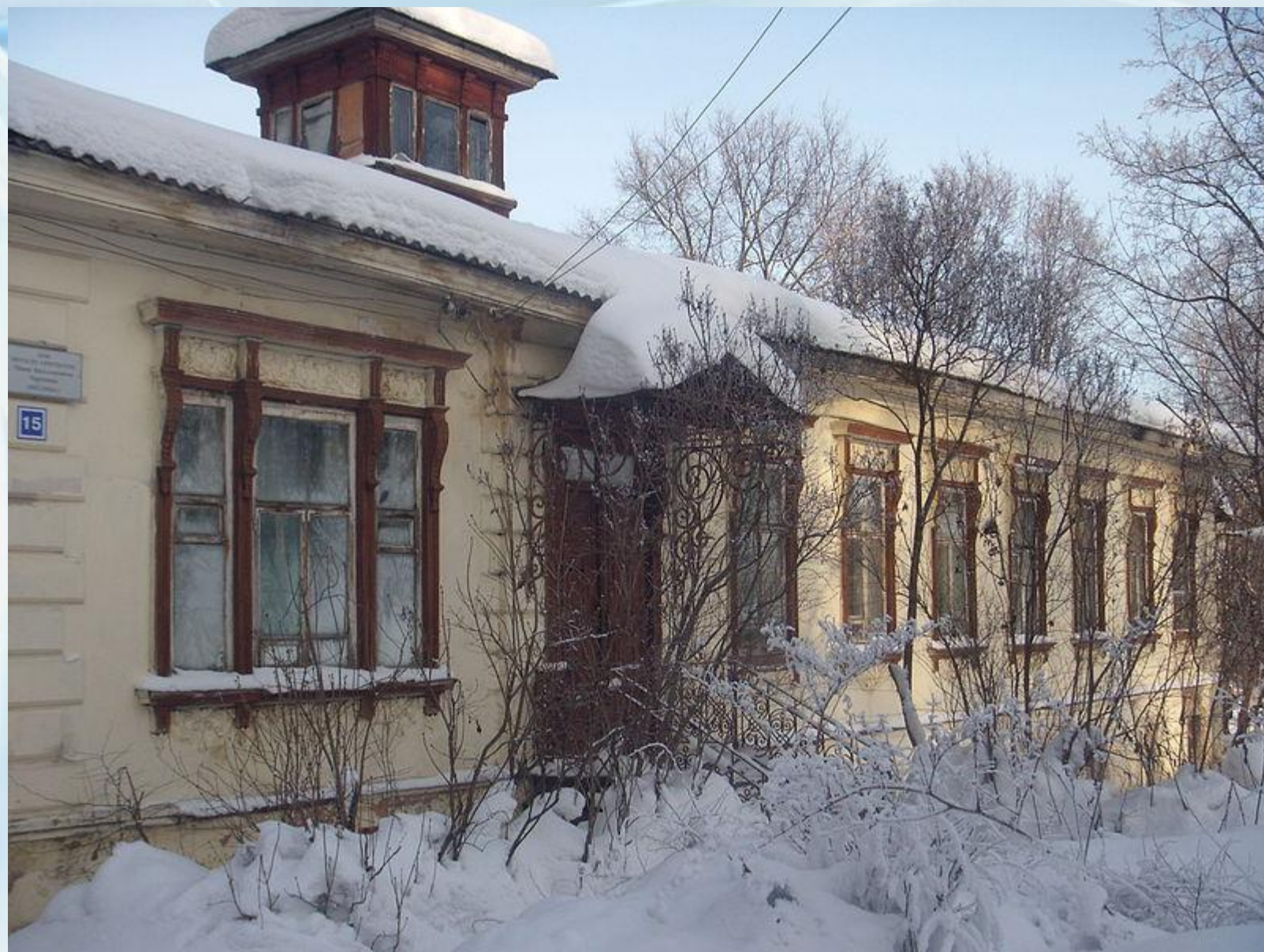
Дом, в котором прошли детские и юношеские годы Е. Чарушина в Вятке.