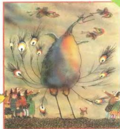
Рис. С. ОСТРОВА