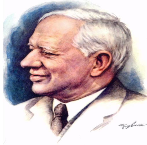
Корней Иванович Чуковский (1882—1969)