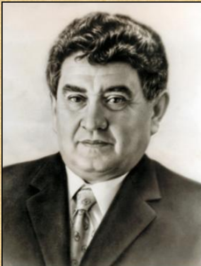
Виктор Юзефови ч Драгунски й