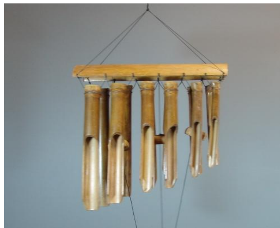
гребенка – музыка ветра.