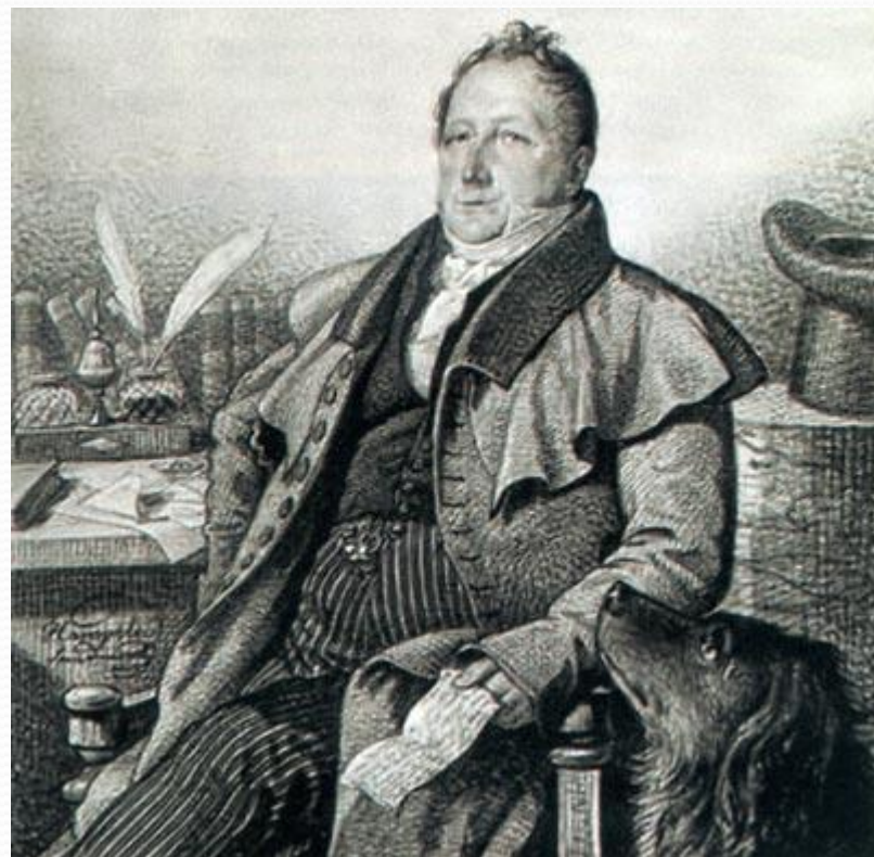
Сергей Львович Пушкин (1770-1848), отец поэта. Неизв. художник. 1810-е гг.

Отец поэта, Сергей Львович Пушкин. Отставной военный, был старинного рода, ноне богат и не слишком удачлив в службе и чинах.