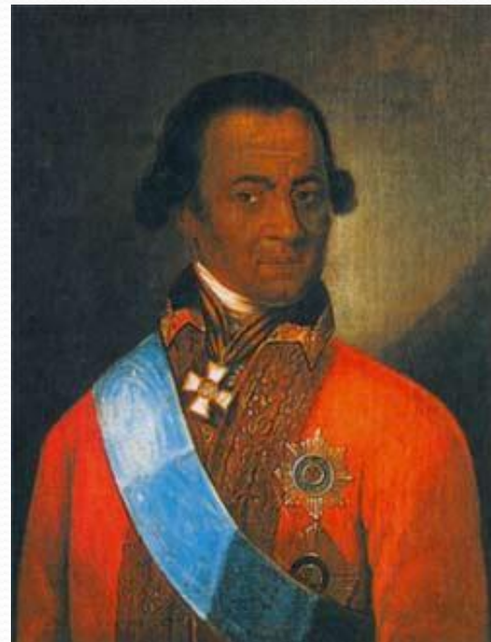
Прадед Александра Сергеевича — знаменитый «арап» Ибрагим (Абрам) Ганнибал, крестник Петра Великого.

Мать поэта, Надежда Осиповна, была внучкой знаменитого Ибрагима Ганнибала.