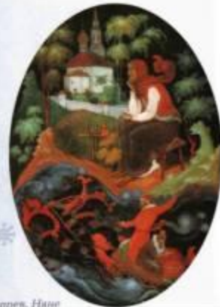
К. Бокарев. Няне