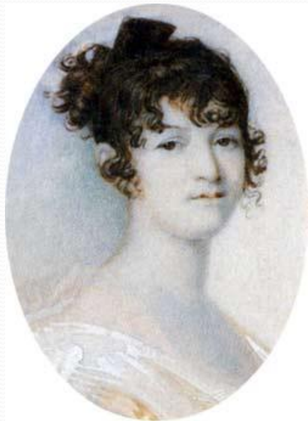
Надежда Осиповна Пушкина, рожд. Ганнибал (1775-1836), мать поэта. Художник Ксавье де Местр. 1800-е гг.

Мать поэта, Надежда Осиповна, была внучкой знаменитого Ибрагима Ганнибала.