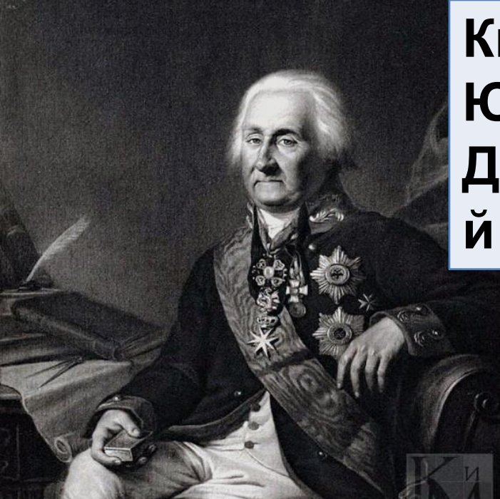
Князь Юрий Долгоруки й