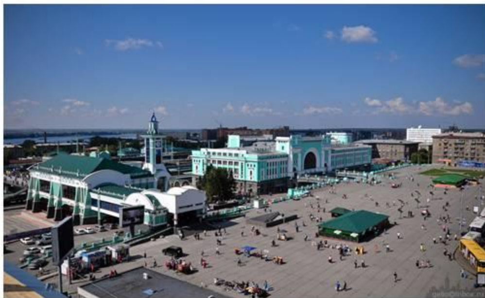
Площадь в Новосибирске им. Гарина Михайловского

Новосибирцы увековечили память о Н. Г. Гарине-Михайловском, присвоив его имя привокзальной площади, станции метро, школе, одной из библиотек города.