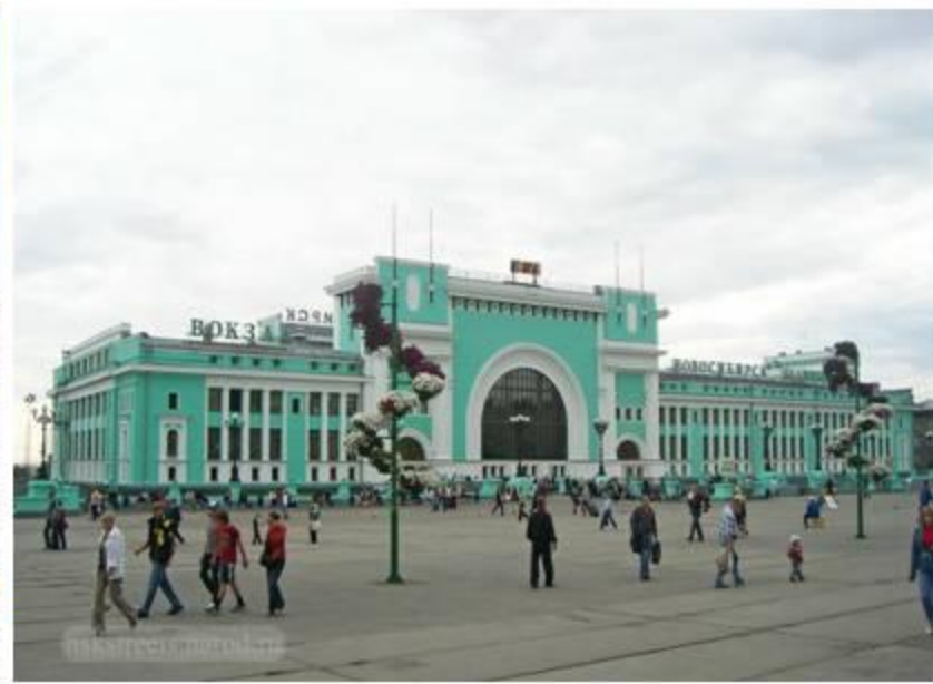
Железнодорожный вокзал Им. Гарина-Михайловского