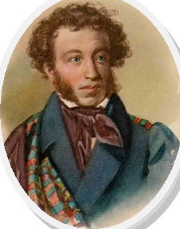
Пушкин Александр Сергеевич 1799-1837

Трудно найти в нашей стране человека, который бы не знал и не любил замечательные произведения великого русского поэта Александра Сергеевича Пушкина. Ещё при жизни его называли «солнцем русской поэзии». Прошло больше 170 лет с тех пор, как погиб поэт, а наша любовь к нему всё также крепка, стихи его становятся нам всё ближе, дороже и нужнее.