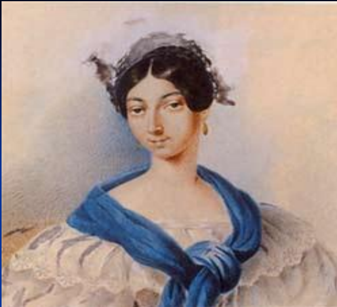
Павлищцева Ольга Сергеевна, рожд. Пушкина (1797-1868) — сестра поэта.