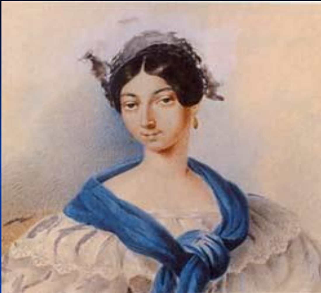
Павлищева Ольга Сергеевна, рожд. Пушкина (1797-1868) — сестра поэта.