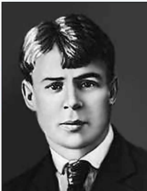
*Сергей Александрович Есенин 1895-1925