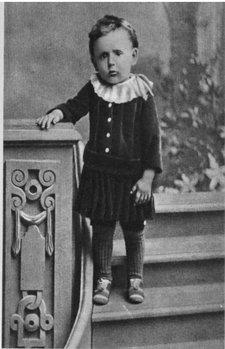
С. Я. Маршак. Около 1889 г.