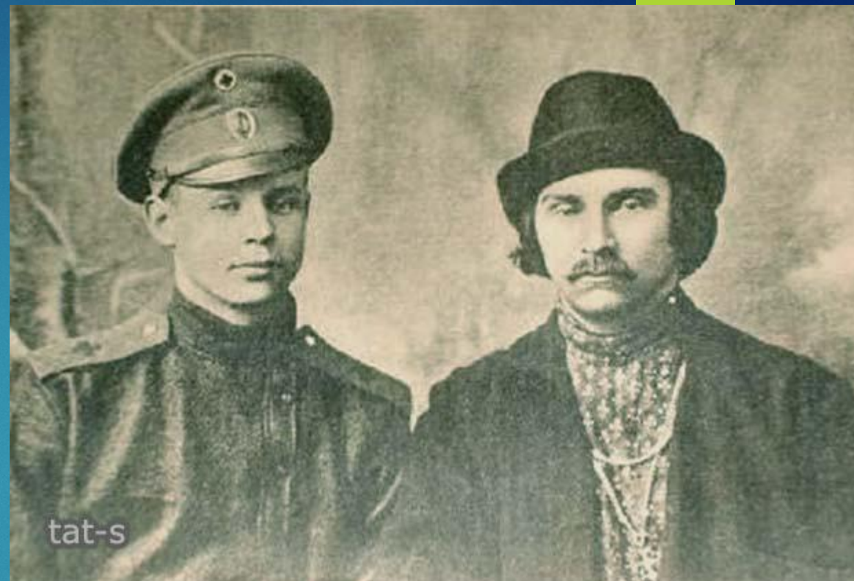
Поэты Сергей Есенин и Николай Клюев (1887 - 1937) Фото - 1916 год.

В 1914 г. в столичном издании для детей «Мирок» было опубликовано дебютное стихотворение поэта «Берёза», что стало стартом литературного призвания Сергея Есенина, которого сегодня знает весь мир.