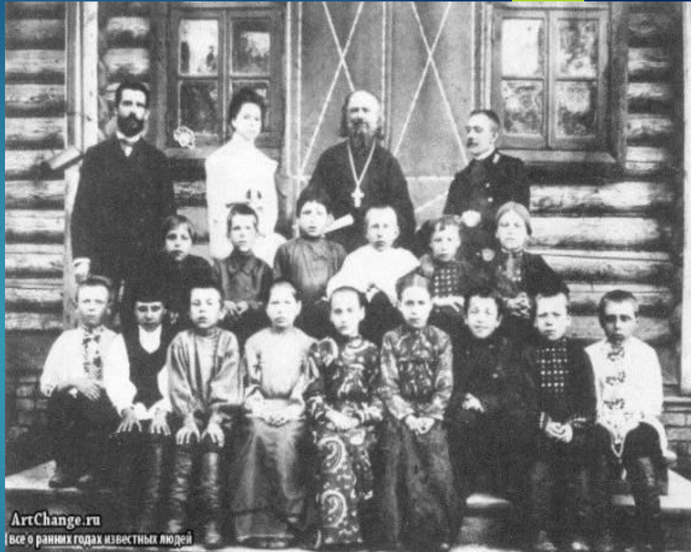
Учителя Есенина с учащимися Константиновского земского училища

В девять лет Есенина отдали на обучение в земскую школу. Там он практически не разлучался с книгами и хорошо успевал. Однако за неудовлетворительно е поведение ему прибавили дополнительный год учёбы. Сдал по выпуску экзамены на сплошные пятёрки.