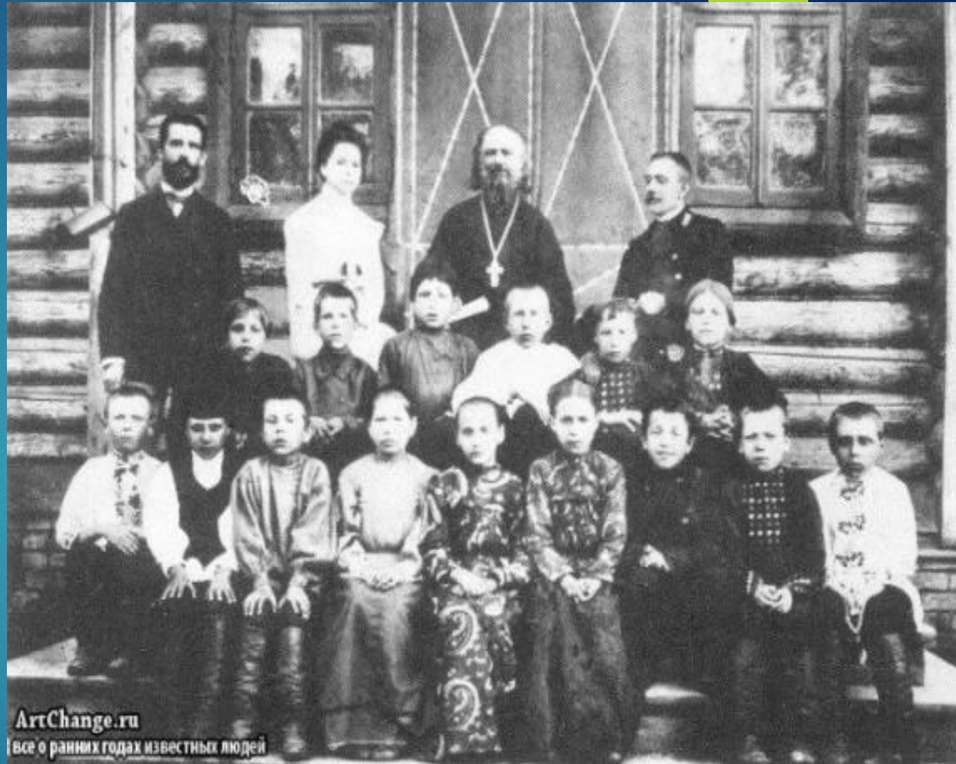
Учителя Есенина с учащимися Константиновского земского училища

В девять лет Есенина отдали на обучение в земскую школу. Там он практически не разлучался с книгами и хорошо успевал. Однако за неудовлетворительно е поведение ему прибавили дополнительный год учёбы. Сдал по выпуску экзамены на сплошные пятёрки.