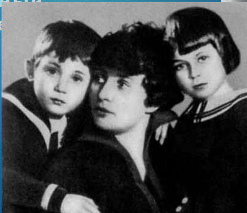
Жена Есенина, актриса - Зинаида Николаевна Райх (1894 - 1939)