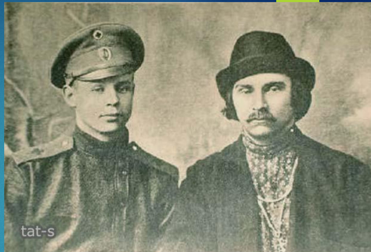
Поэты Сергей Есенин и Николай Клюев (1887 - 1937) Фото - 1916 год.

В 1914 г. в столичном издании для детей «Мирок» было опубликовано дебютное стихотворение поэта «Берёза», что стало стартом литературного призвания Сергея Есенина, которого сегодня знает весь мир.