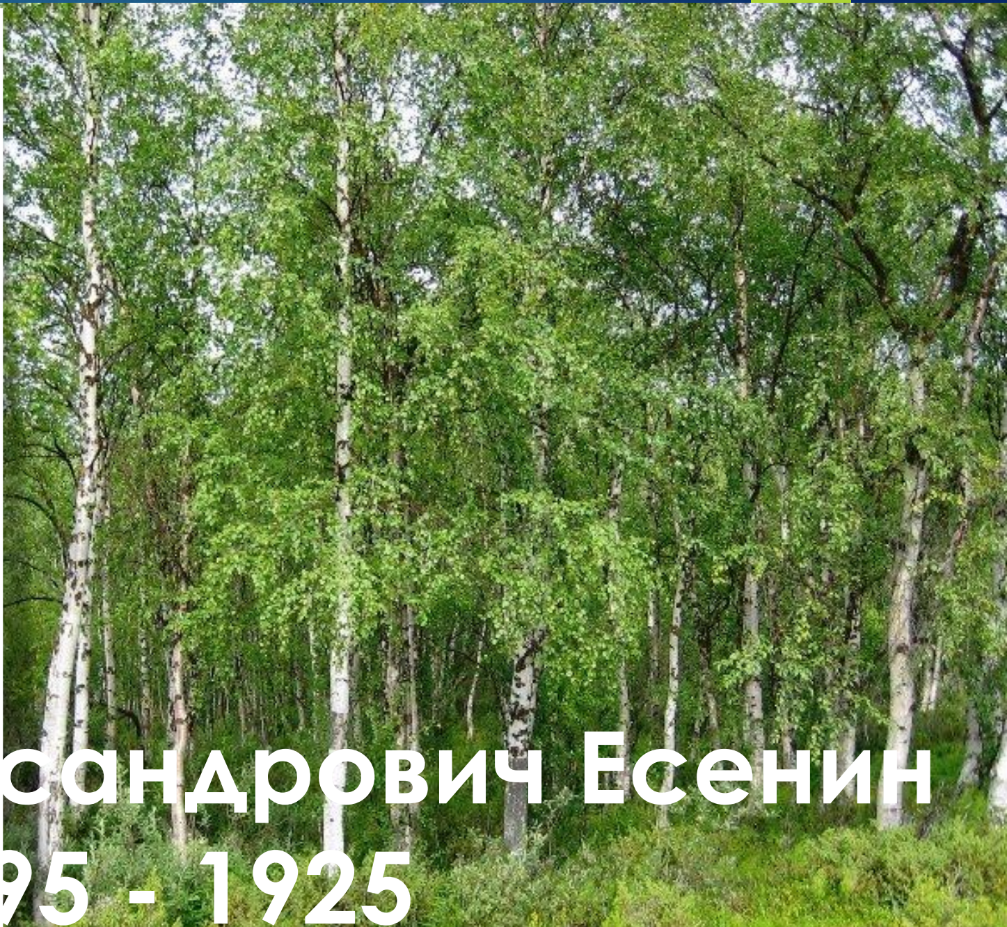
Сергей Александрович Есенин 1895 - 1925