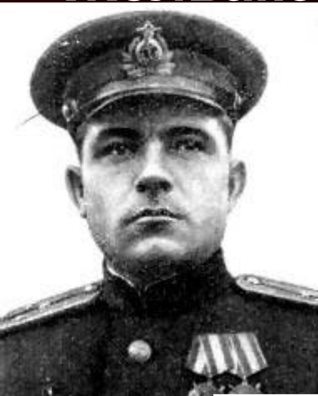
МЕДАЛЬ «ЗОЛОТАЯ ЗВЕЗДА» ГЕРОЯ СОВЕТСКОГО СОЮЗА