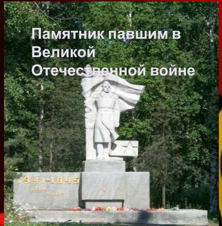
Памятник павшим в Великой Отечественной войне