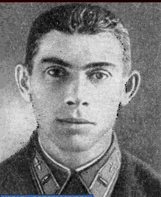
МЕДАЛЬ «ЗОЛОТАЯ ЗВЕЗДА» ГЕРОЯ СОВЕТСКОГО СОЮЗА