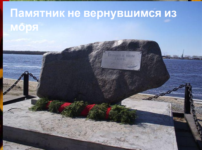
Памятник не вернувшимся из моря