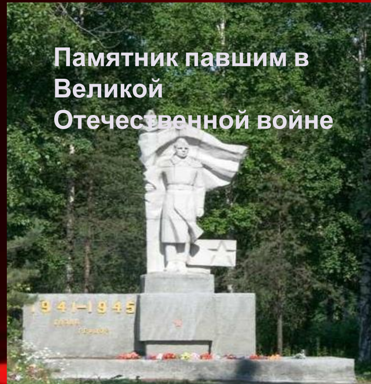
Памятник павшим в Великой Отечественной войне