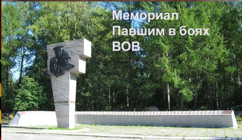
Мемориал Павшим в боях ВОВ