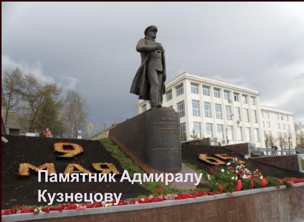
Памятник Адмиралу Кузнецову