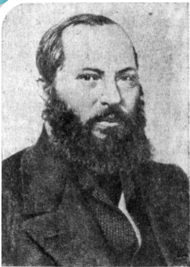
Афанасий Афанасьевич Фет.