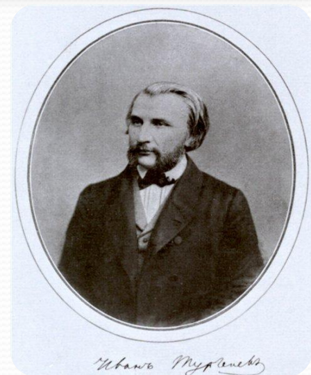
Иван Тургенев Иван Тургенев