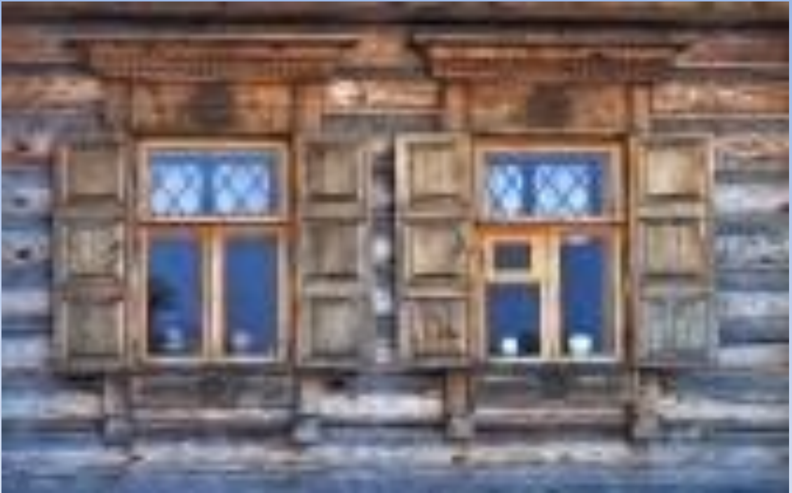
ДОМ СО СТАВНЯМИ