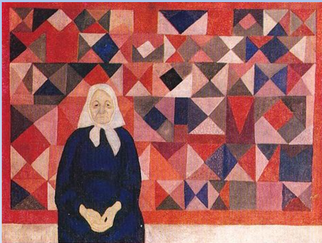
Виктор Попков «Моя бабушка и её ковёр»

Помощь консультанта Кота Учёного (раздел «Музей»).