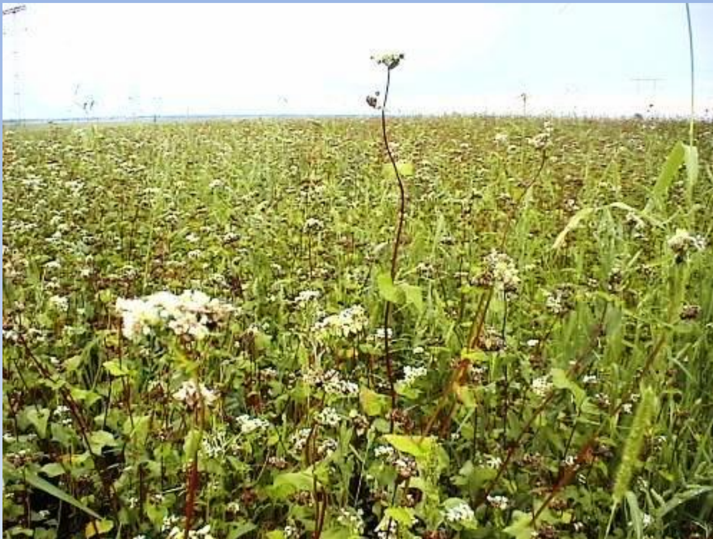
«поле с гречихой»