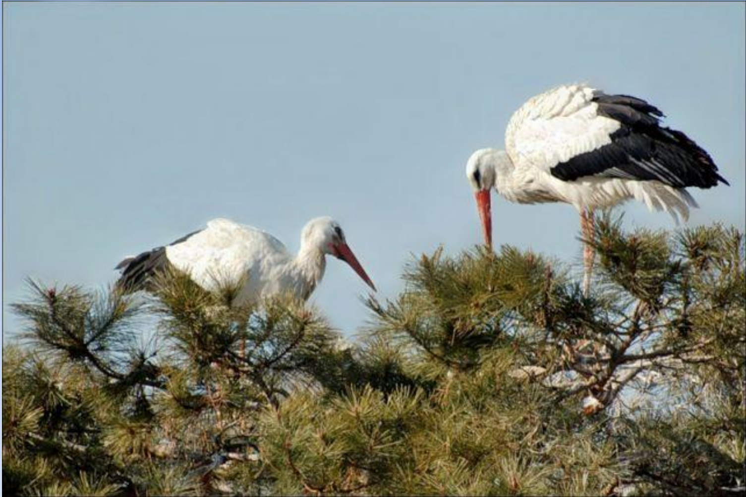
«аист на крыше»