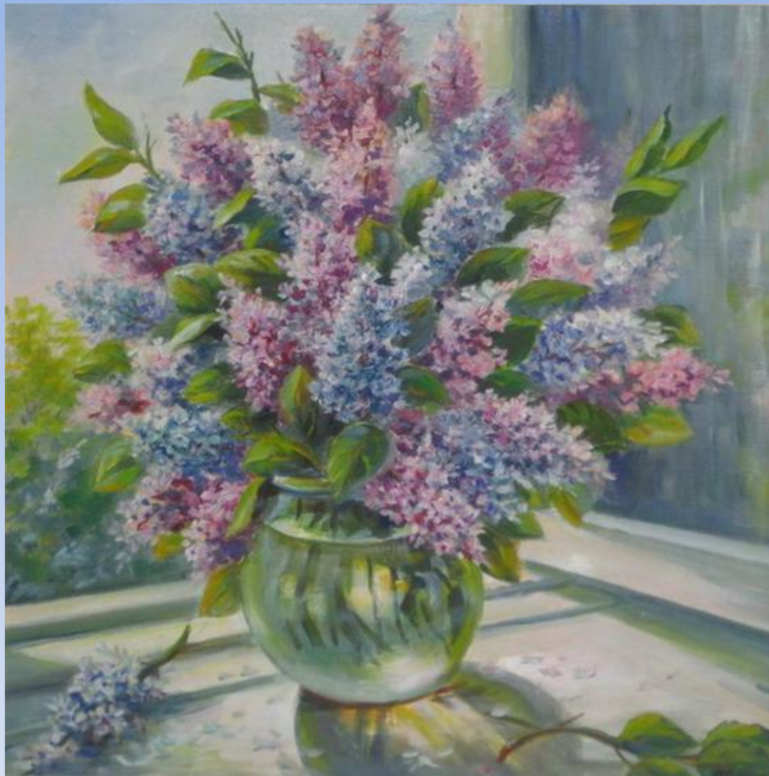
«сирень на окне»