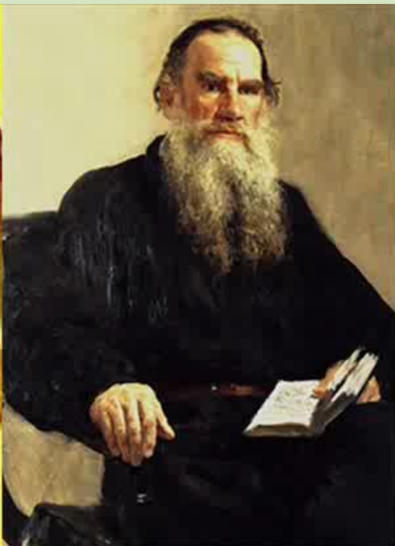
Лев Николаевич Толстой