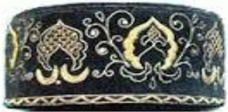
Мужской головной убор - тибетейва