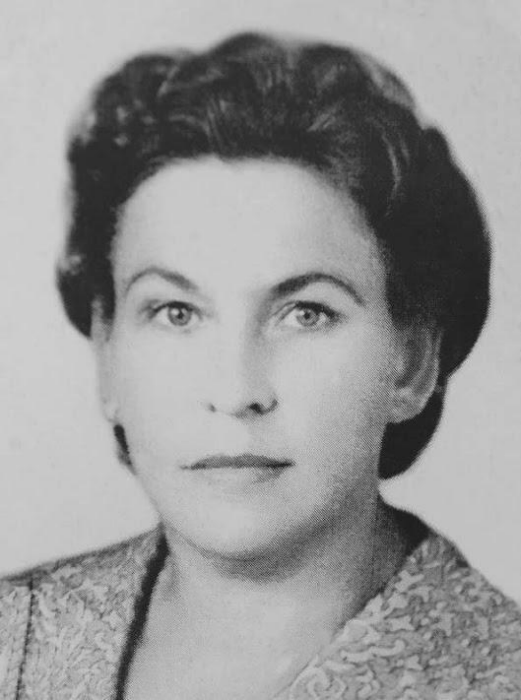
Валентина Александровна Осеева (1902 – 1969г)