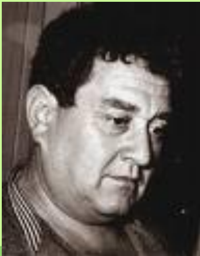
Виктор Юзефович Драгунский