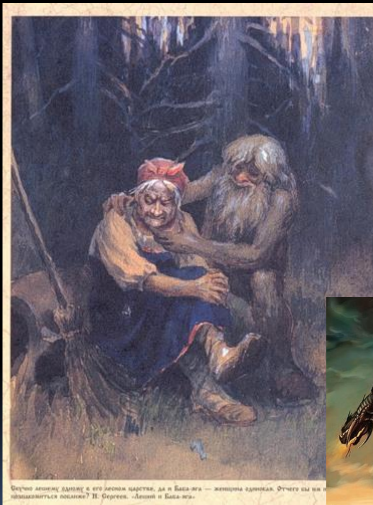
Судно лесному дедушке в его лесном царстве, да и Баба-яга — женщина-завидка. Отчего вы не познакомитесь поближе? И. Герасов. «Лесной и Баба-яга».