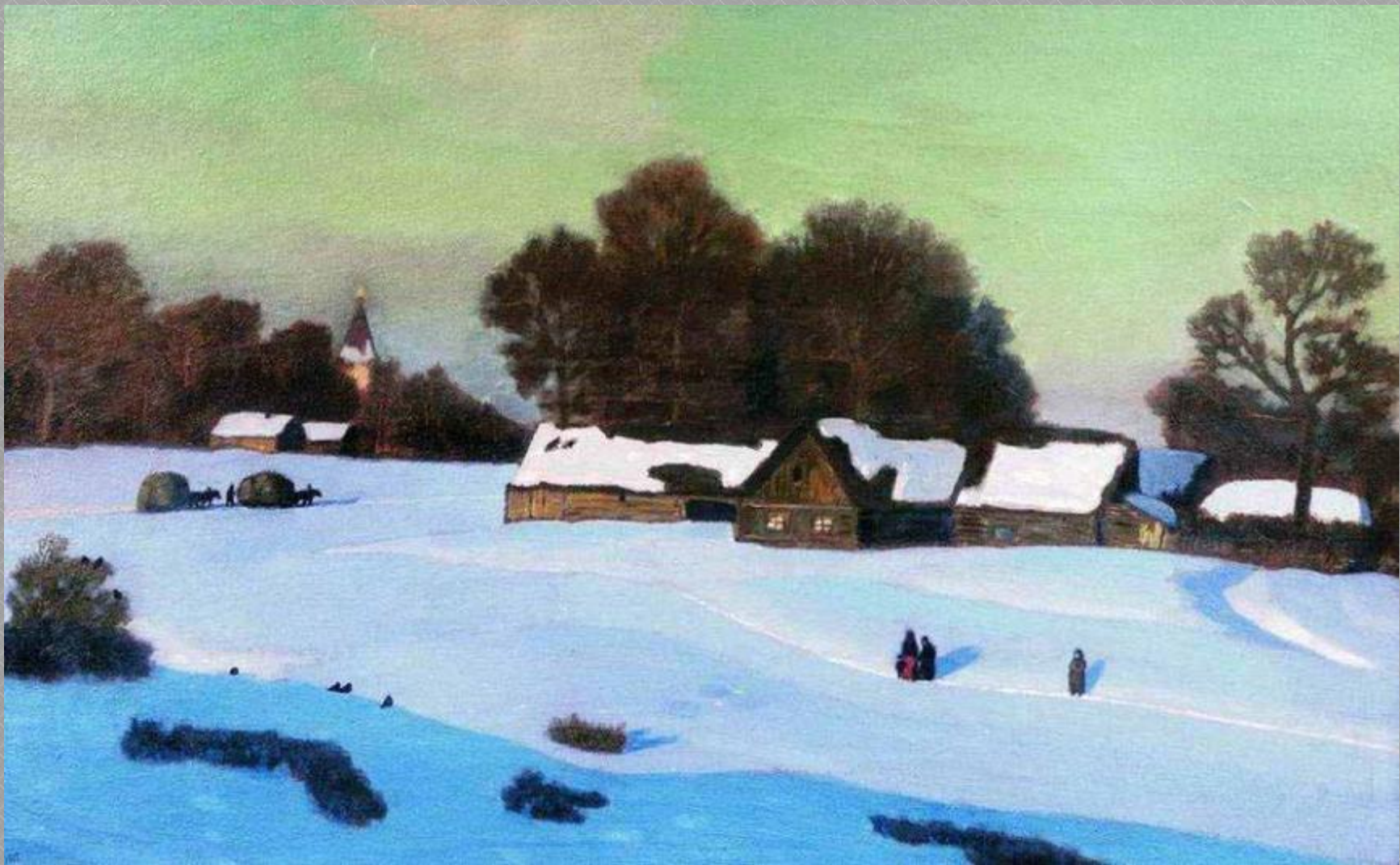
Н. П. Крымов «Зимний вечер»