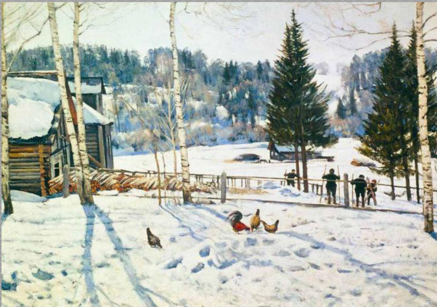
К. Ф. Юон «Конец зимы. Полдень. Лигачево»