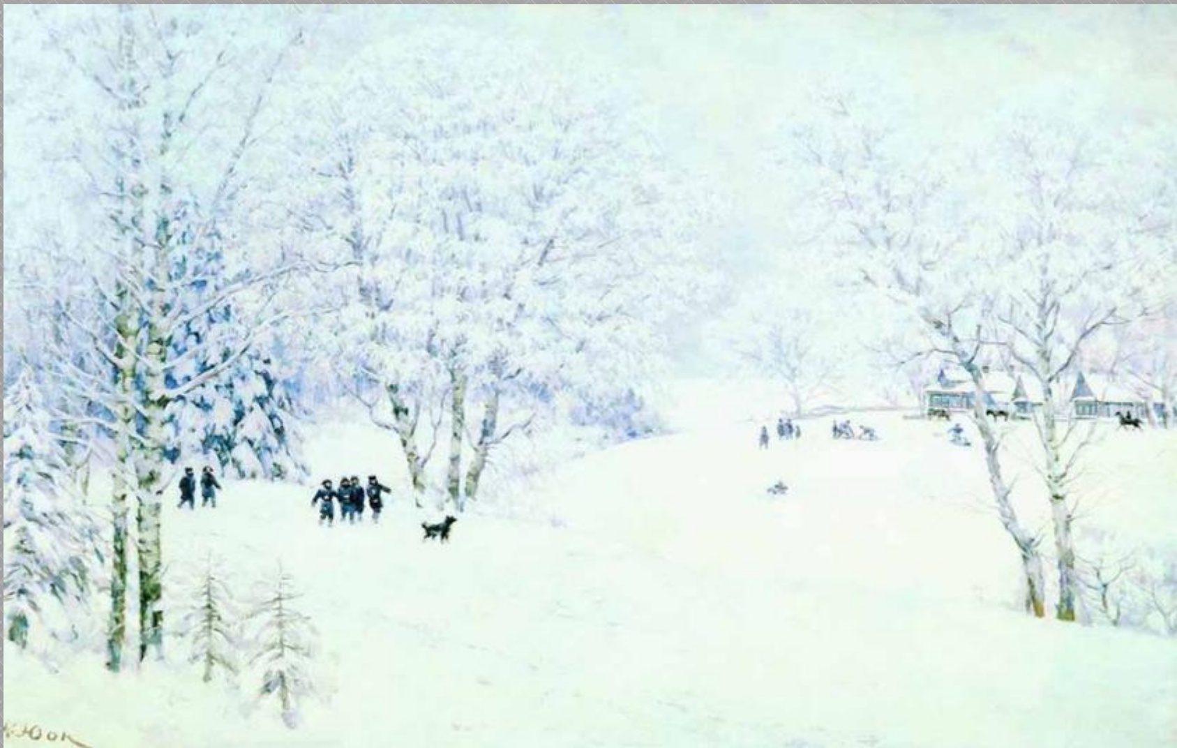
К. Ф. Юон «Русская зима. Лигачево»