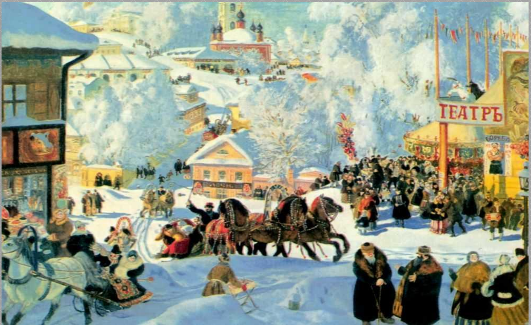
Б. М. Кустодиев «Масленица»