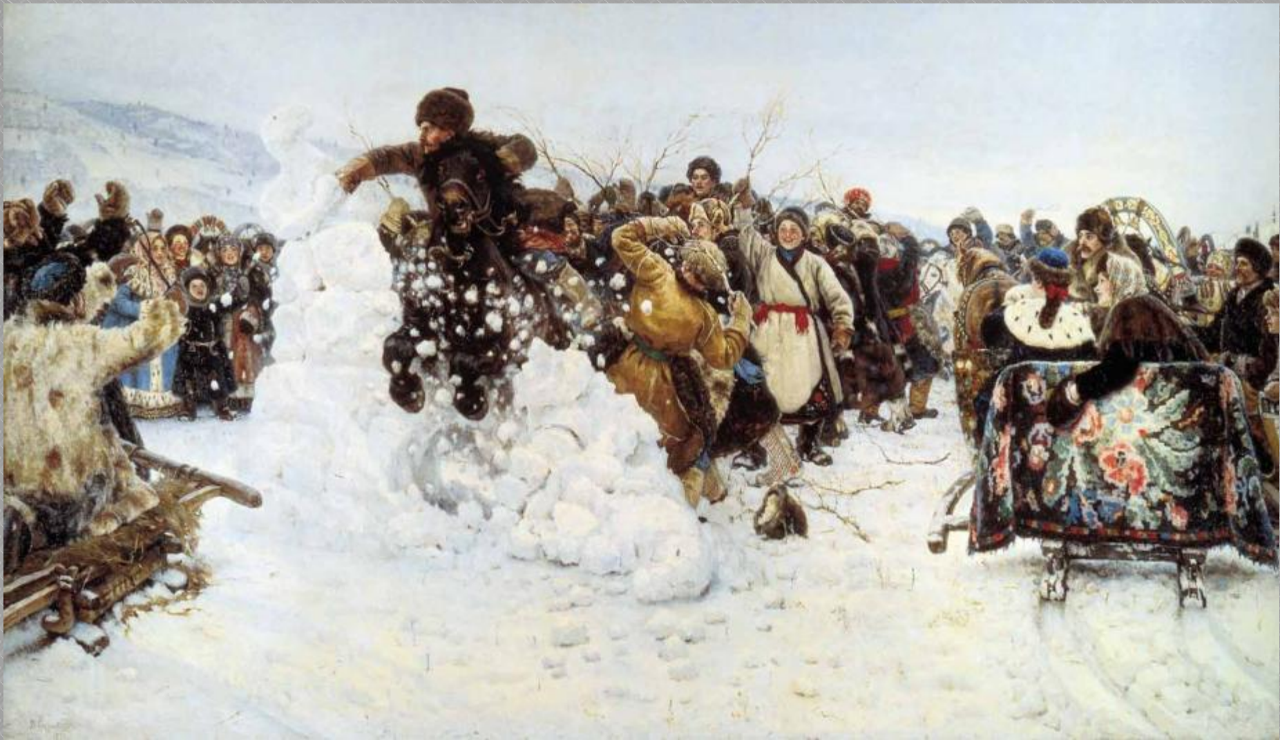
В. И. Суриков «Взятие снежного городка»