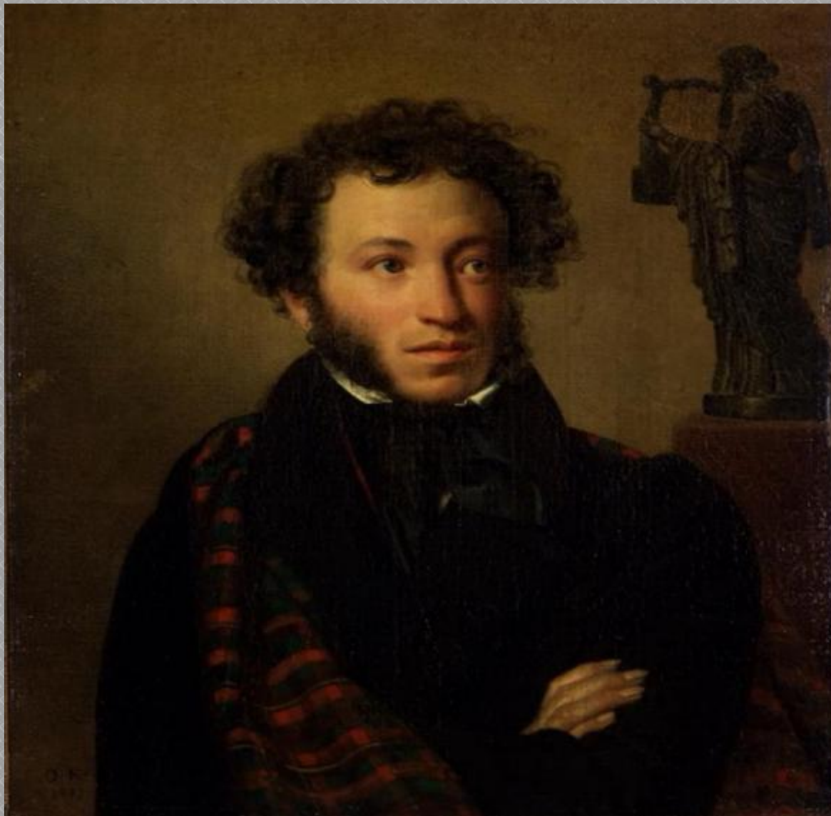
А. С. Пушкин 1799-1837