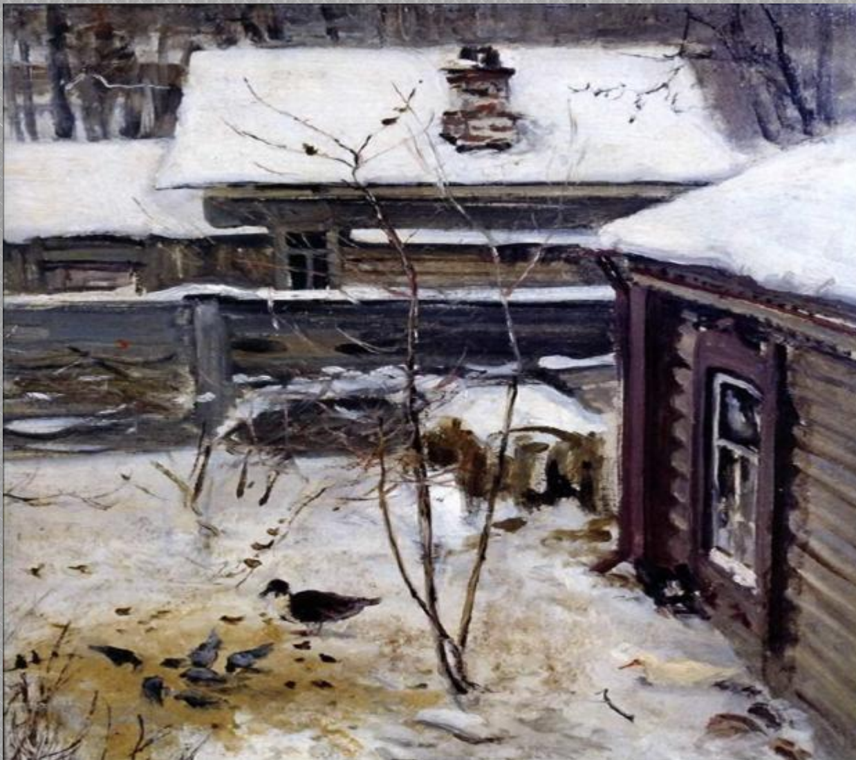
А.К. Саврасов «Дворик. Зима»