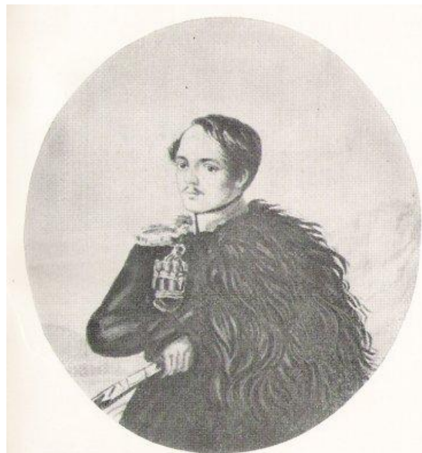
М. Ю. Лермонтов Автопортрет. 1837 г. Акварель.