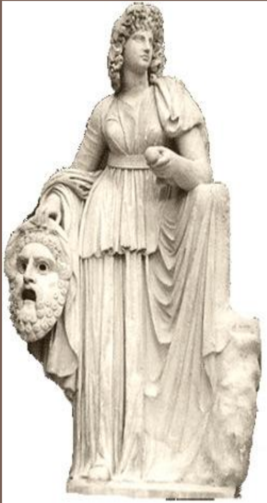
Мельпомена – греческая муза трагедии

возникла из религиозно-культовых обрядов, посвященных богу Дионису ;