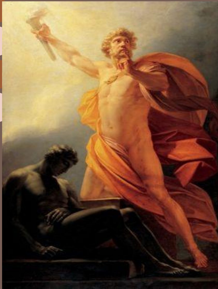
Прометей несёт людям огонь Генрих Фридрих Фюгер, 1817 г.

похитил с Олимпа огонь и передал «все искусства у людей от его людям» 1 ; научил людей строить жилища и добывать металлы, обрабатывать землю и плавать на кораблях, обучил их письму, счёту, наблюдению за звёздами и т. д.