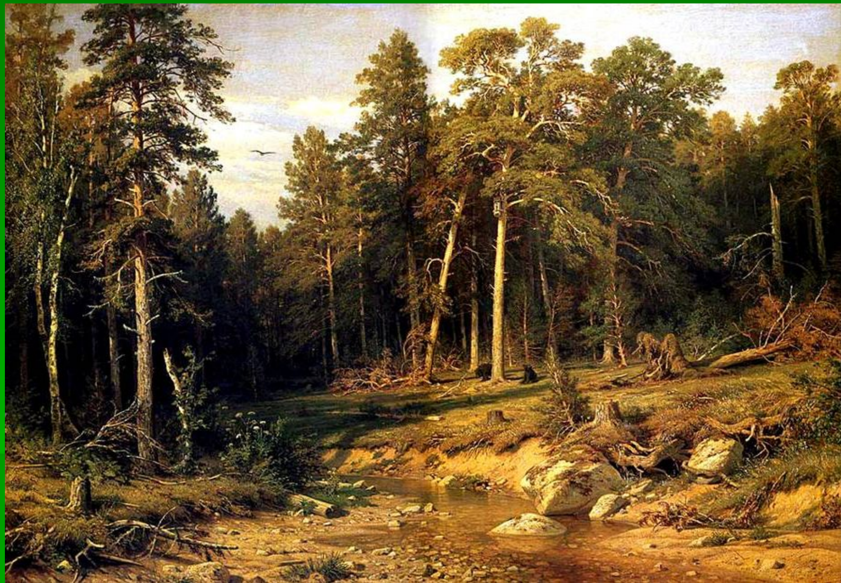
Иван Иванович Шишкин "Сосновый бор"