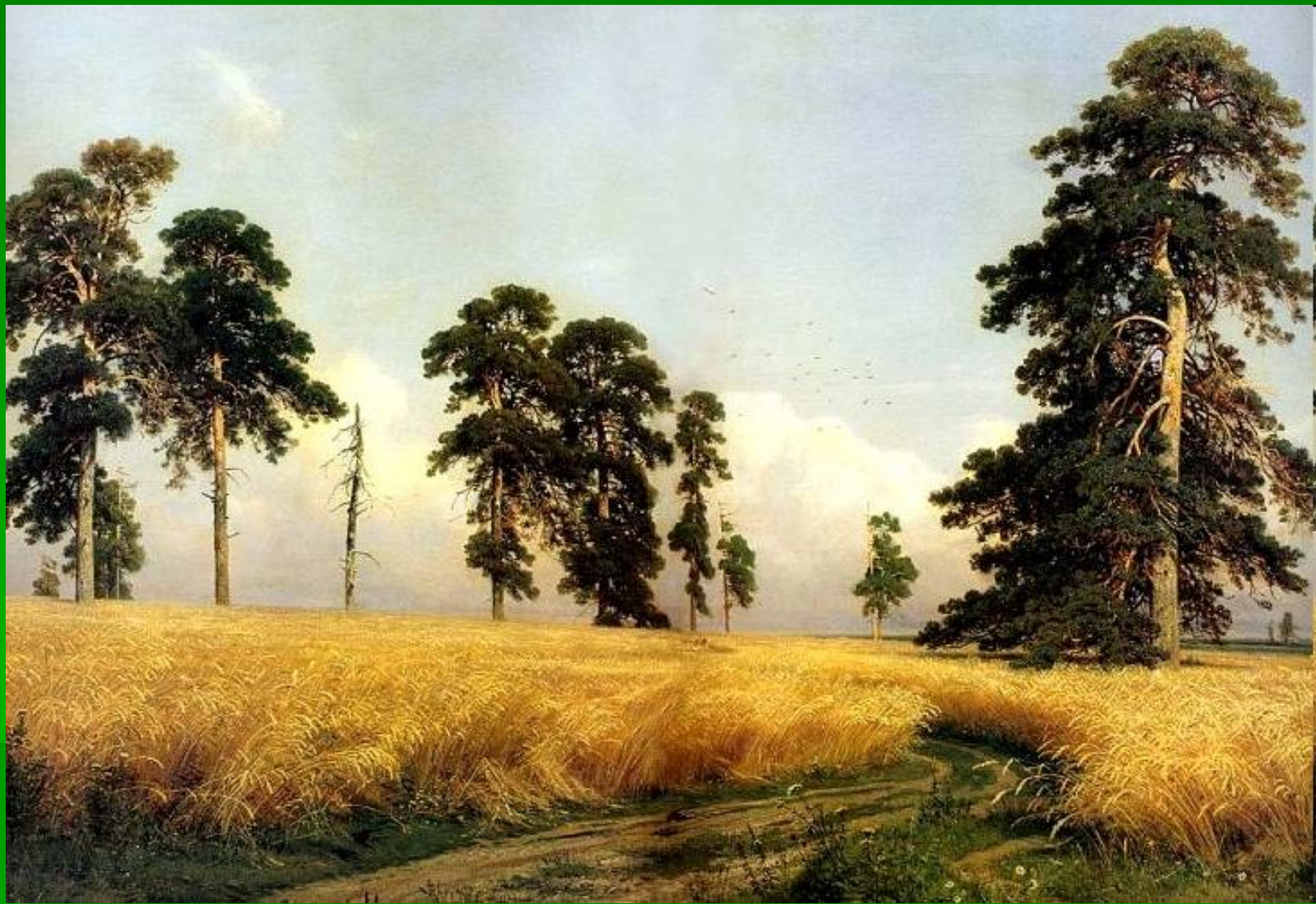
Иван Иванович Шишкин "Рожь"