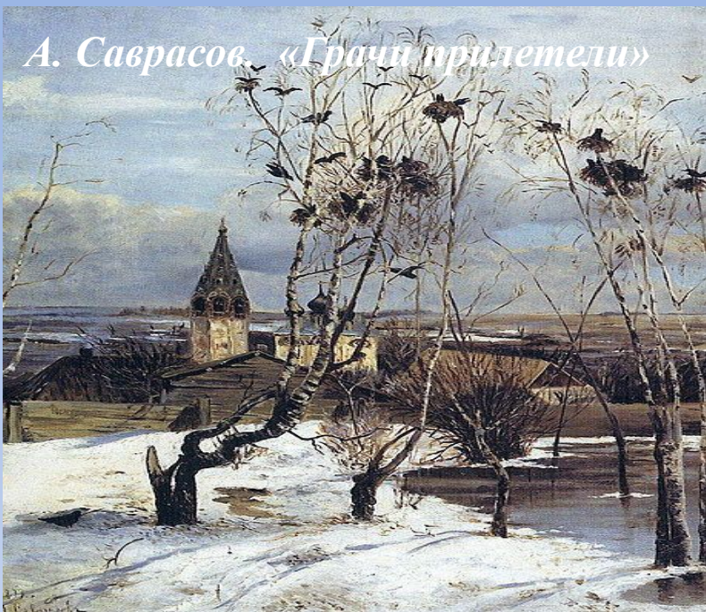
А. Саврасов. «Грачи прилетели»