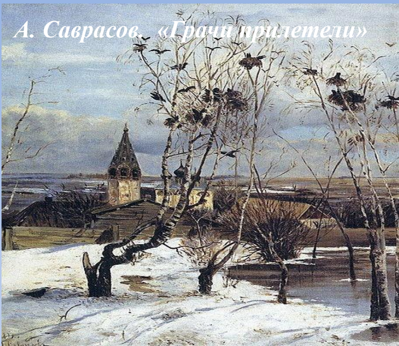
А. Саврасов. «Грачи прилетели»