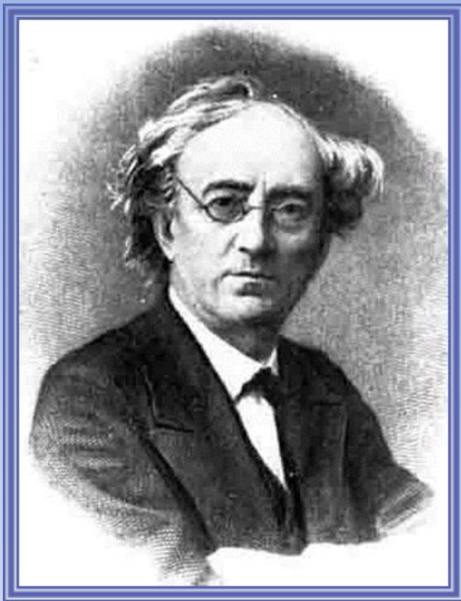
Ф. И. Тютчев