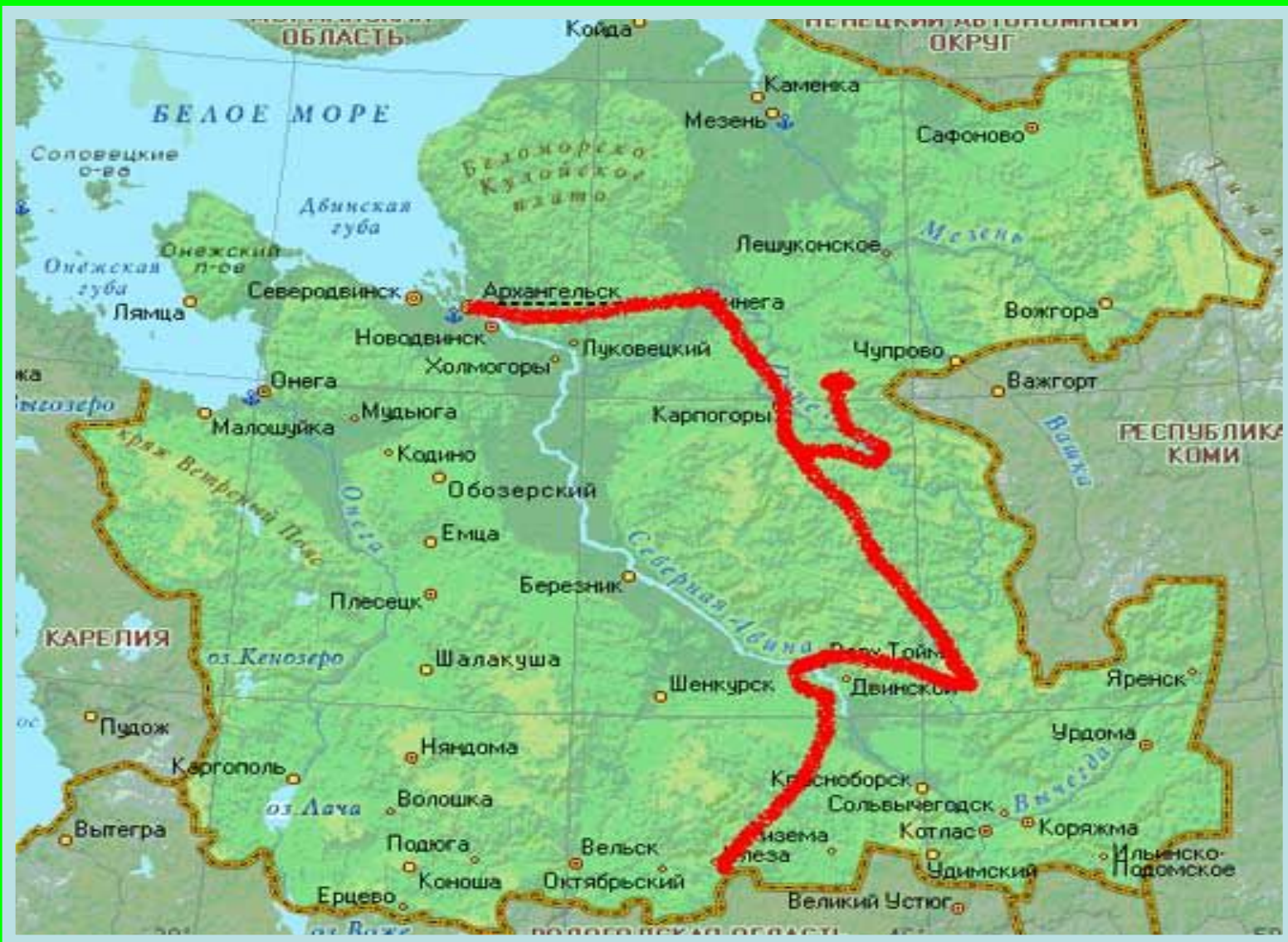
Карта путешествия Михаила Пришвина по Архангельской области.