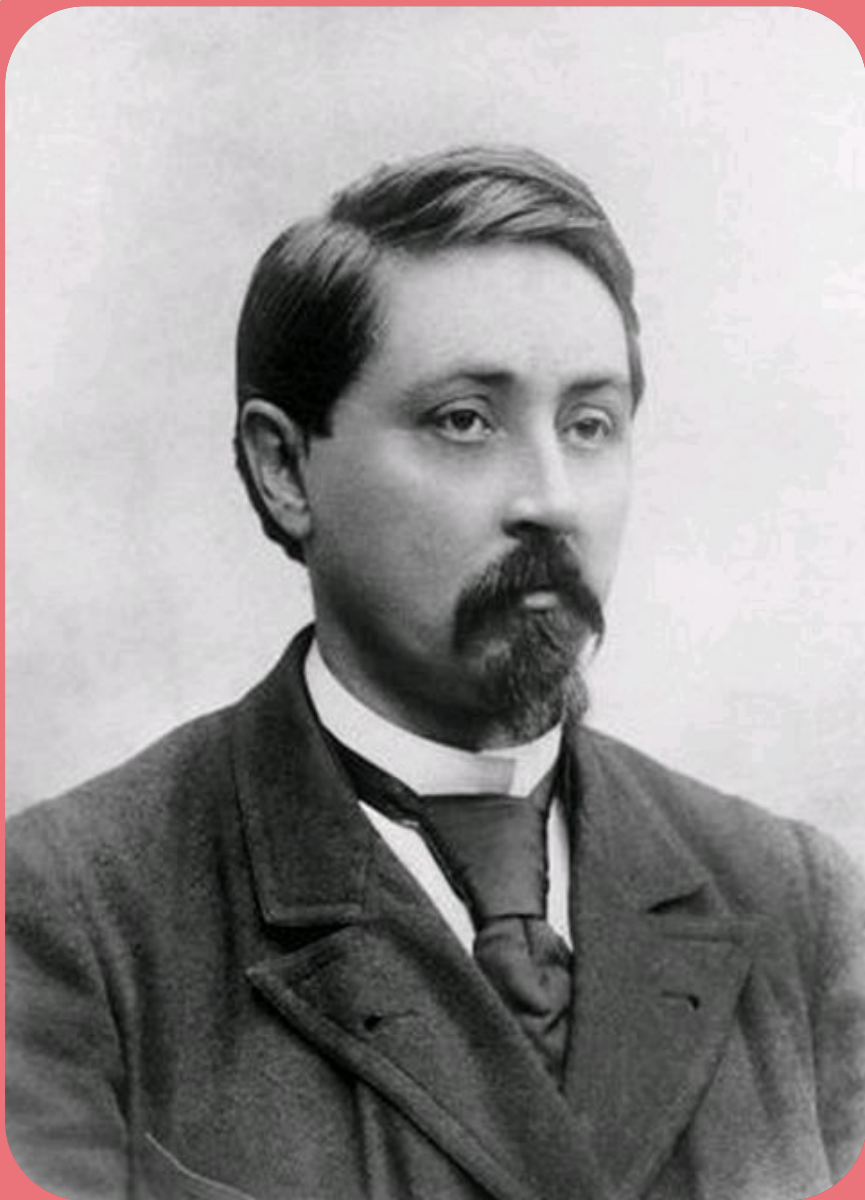
Дмитрий Наркисович Мамин – Сибиряк (1852 – 1912 г.г.)