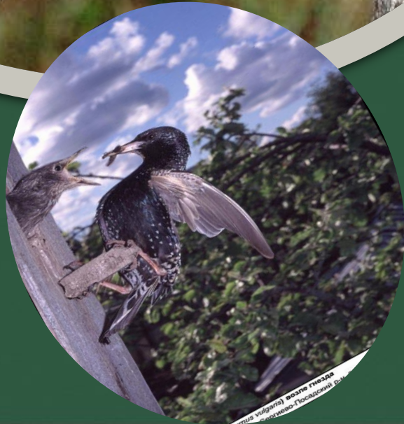
Sturnus vulgaris (L.) Скворец обыкновенный