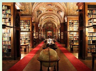
Библиотека «University Club Library», Нью-Йорк, США. (Peter Bond)