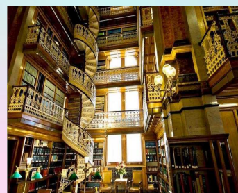
Юридическая библиотека штата Айова, США. (Tani Livengood)