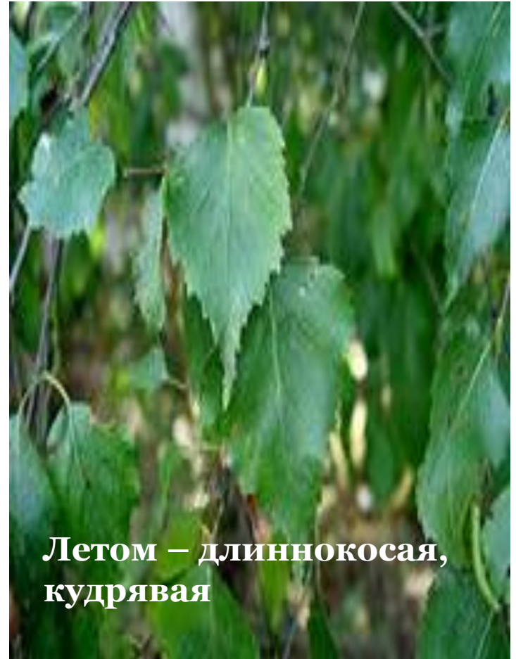
Летом – длиннокосяя, кудрявая

Предмет исследования: использование образа русской берёзы в фольклоре и литературе.