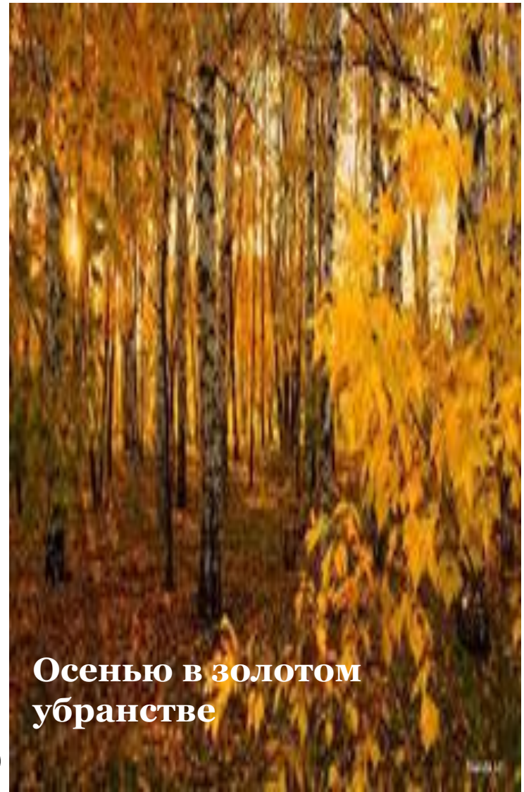
Осенью в золотом убранстве