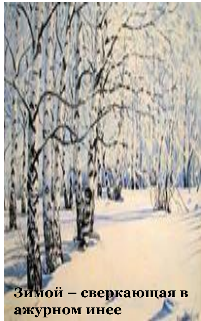
Зимой – сверкающая в ажурном инее

В своей работе мы использовали следующие методы: - теоритические (классификация материала, обобщение и систематизация полученных сведений); - эмпирические (изучение и анализ литературы по данной теме).