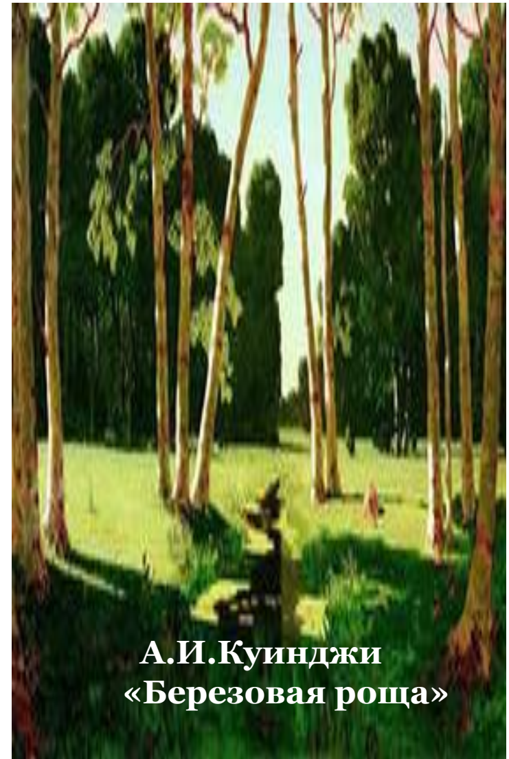
А.И.Куинджи «Березовая роща»