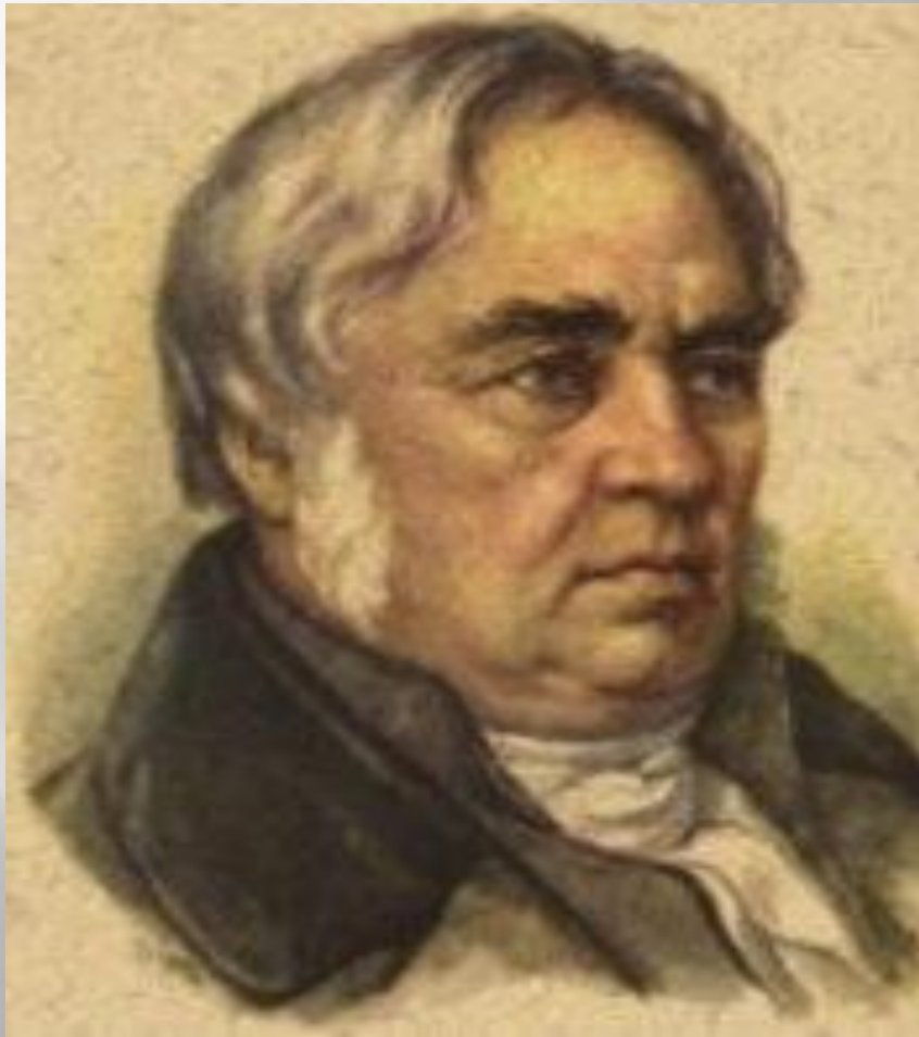
Иван Андреевич Крылов 1769-1844

ОДНИ К ДЕНЬГАМ, ДРУГИЕ К СЛАВЕ РВУТСЯ. ПОСМОТРИШЬ – АЖ КРУЖИТСЯ ГОЛОВА! НЕ НАДО МНЕ НИ СЛАВЫ, НИ СРЕБРА, А ДАЙТЕ ТОЛЬКО К ДЕТСТВУ ПРИКОСНУТЬСЯ!