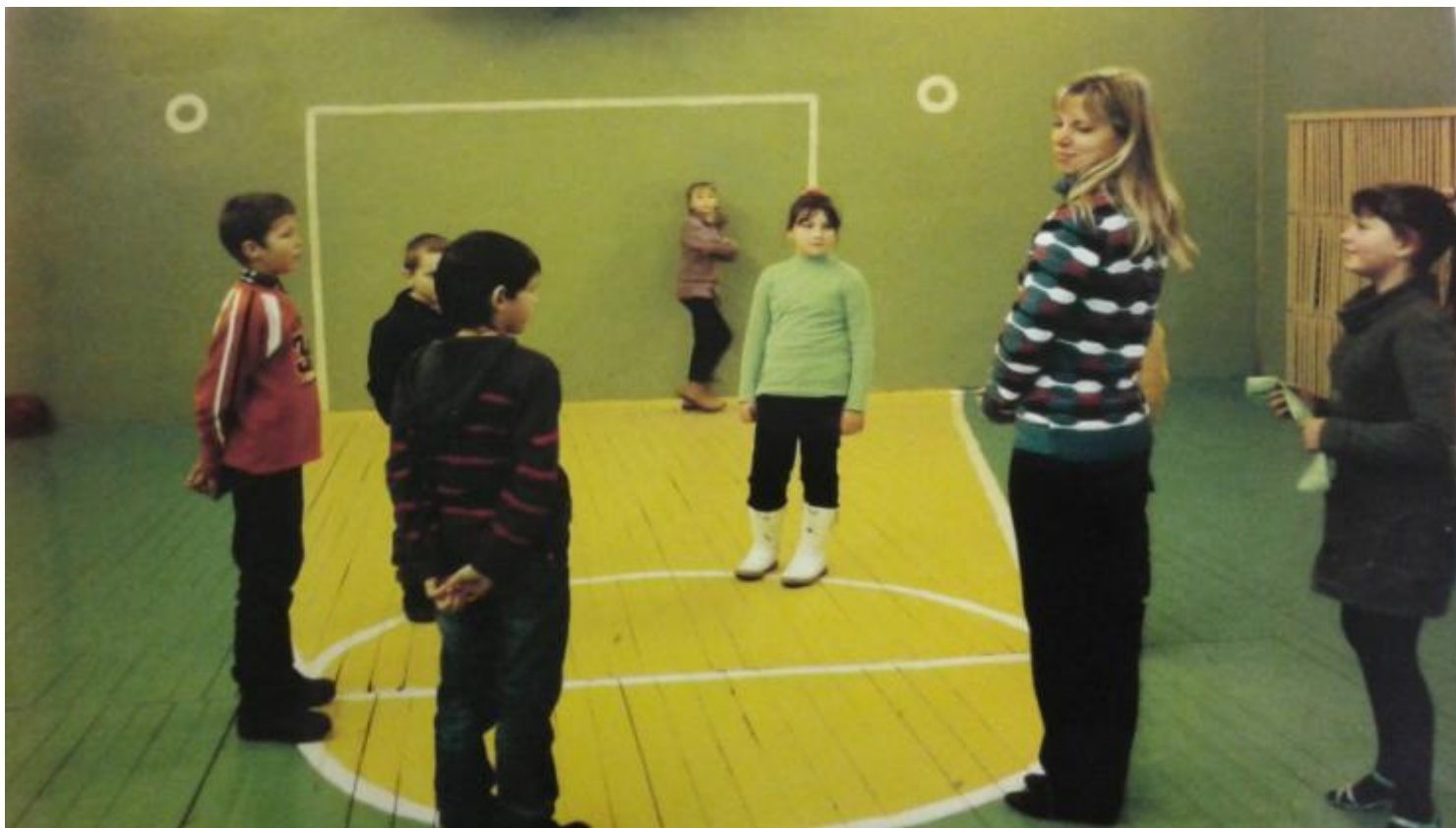
Русская народная игра Ловишка в кругу