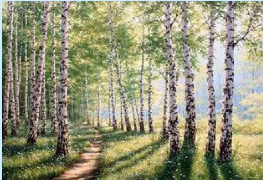
А. Олейник «Березы»