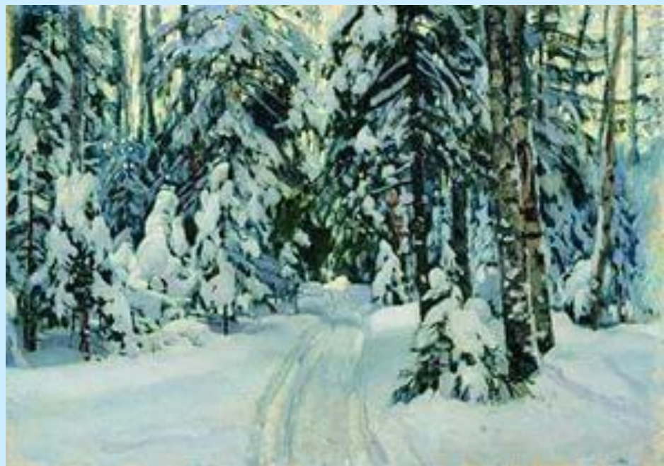
И.И.Шишкин «Зима в лесу»