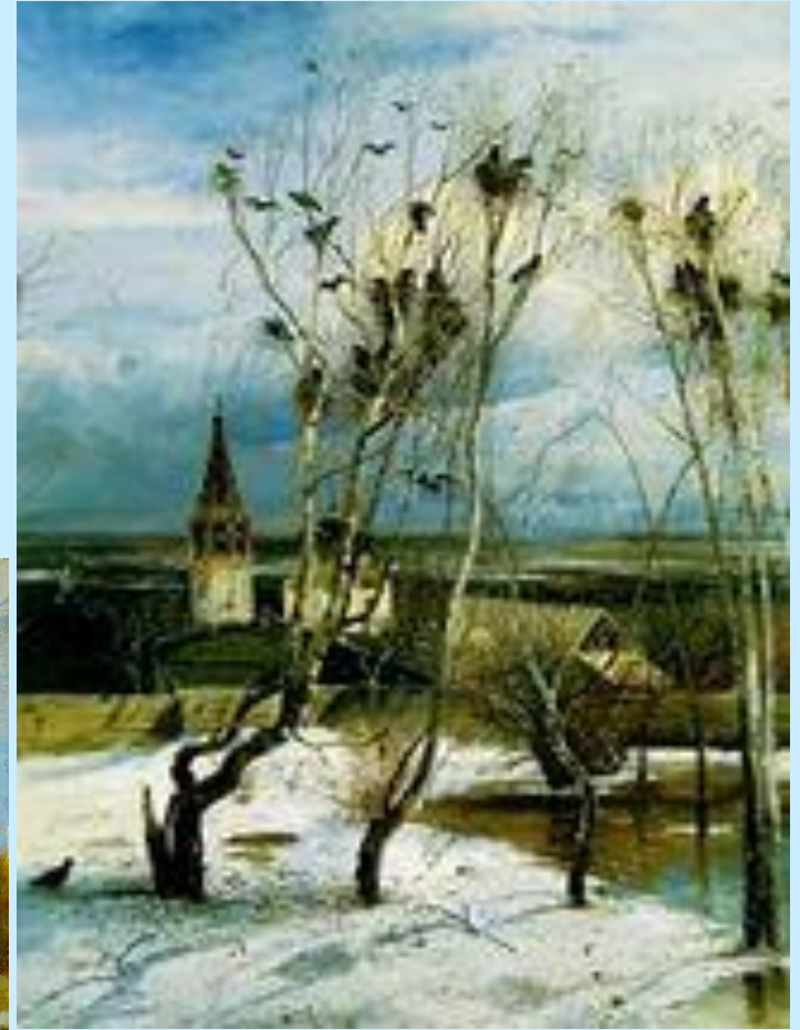
А.Саврасов «Грачи прилетели»