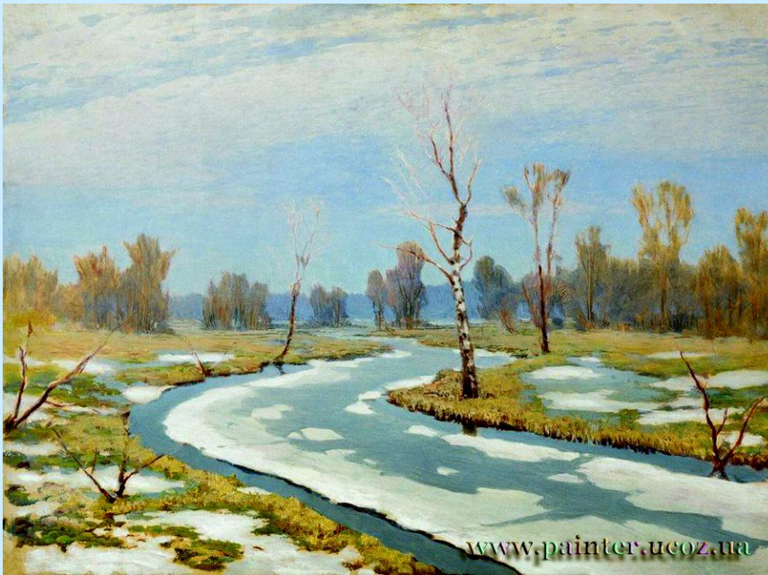
А.Куинджи «Ранняя весна»