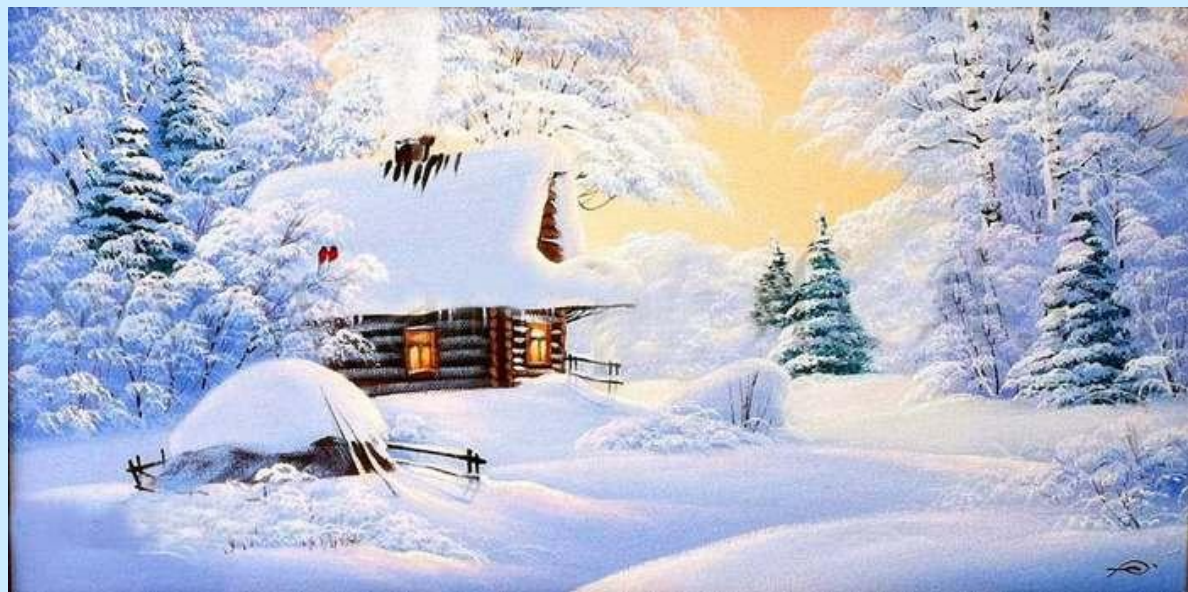
И.Крайнова «Мягкая зима в лесу»