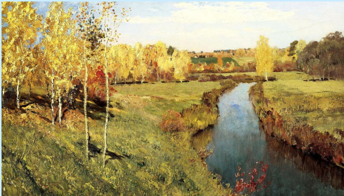
И.Левитан «Золотая осень»