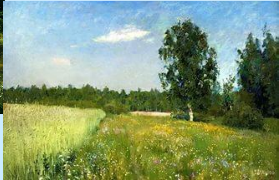
И.Левитан «Июньский день»