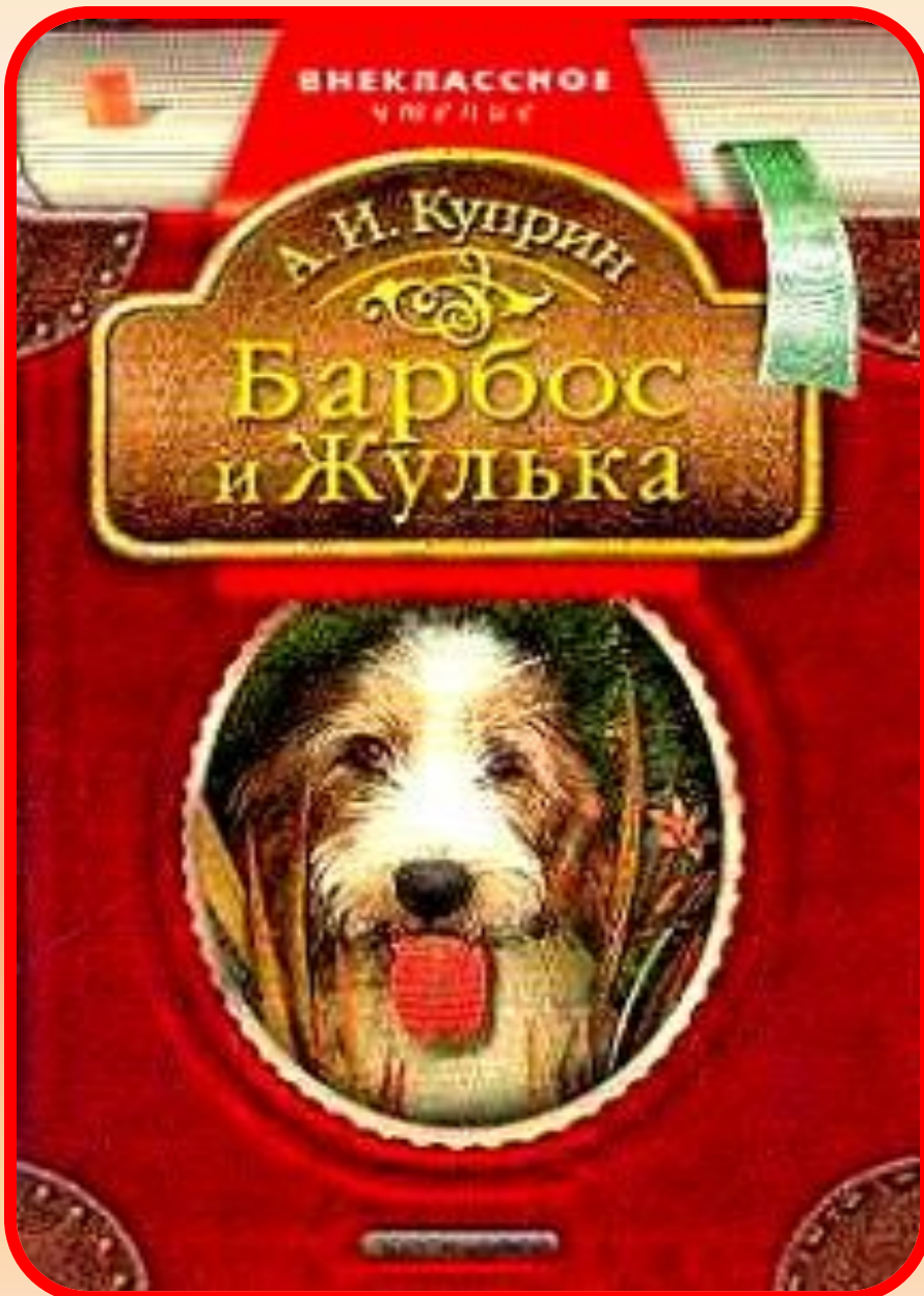
А.Куприн «Барбос и Жулька»