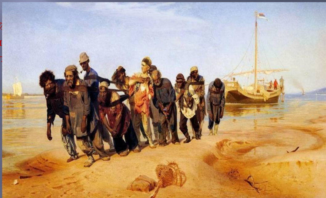
И.Е.Репин. Бурлаки на Волге

..... Выдь на Волгу: чей стон раздаётся Над великою русской рекой? Этот стон у нас песней зовется – То бурлаки идут бечевой!.. Волга! Волга!.. Весной многоводной Ты не так заливаешь поля, Как великою скорбью народной Переполнилась наша земля, – Где народ, там и стон... Эх, сердечный Что же значит твой стон бесконечный Ты проснешься ль, исполненный сил Иль, судеб повинуюсь закону, Всё, что мог, ты уже совершил, – Создал песню, подобную стону, И духовно навеки почил?..