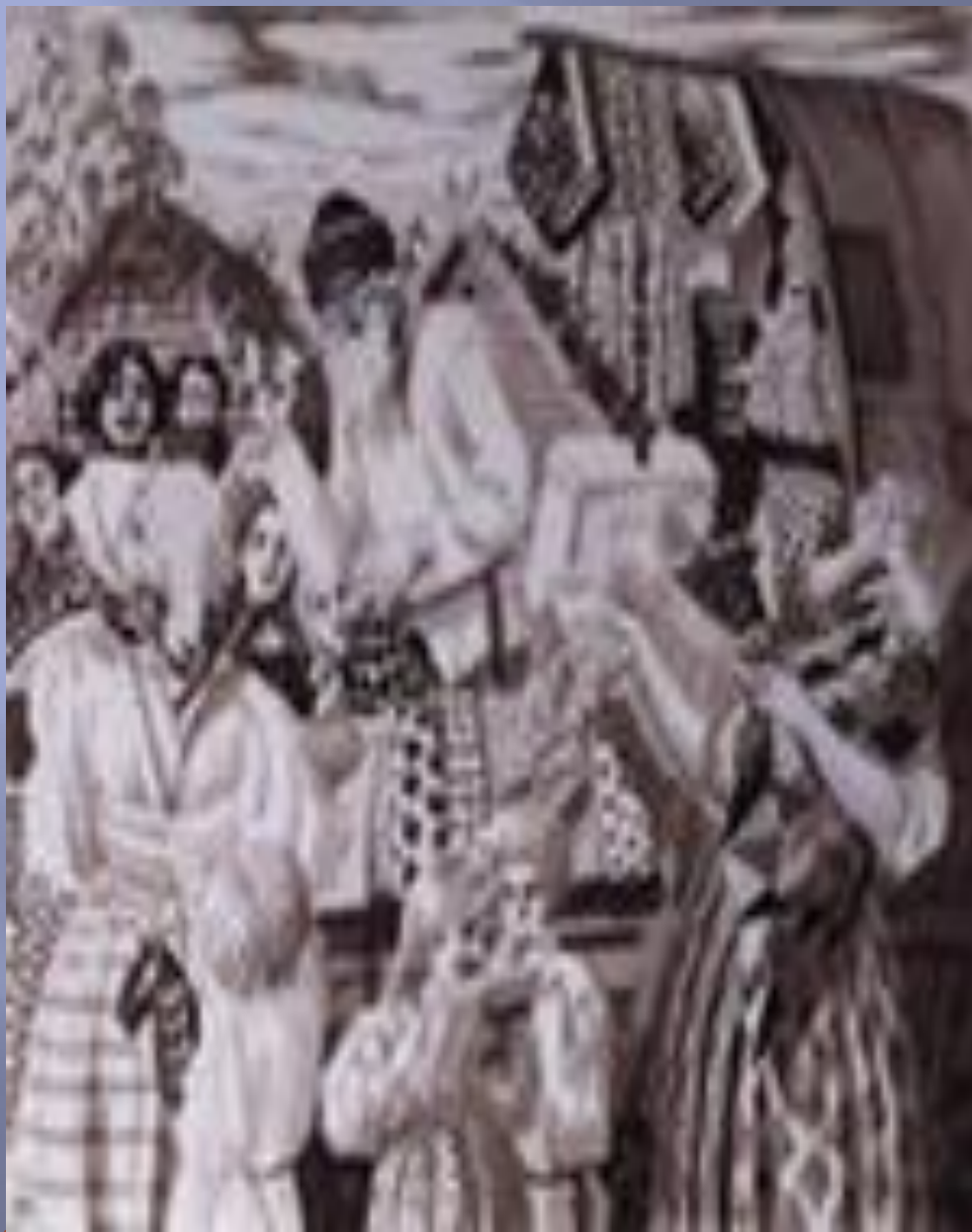
Иллюстрация к стихотворению «Дядюшка Яков» Н.А. Некрасова

Дом - не тележка у дядюшки Якова. Господи боже! чего-то в ней нет! Седенький сам, а лошадка каракова; Вместе обоим сто лет. Ездит старик, продает понемногу, Рады ему, да и он-то того: Выпито вечно и сыт, слава богу. Пусто в деревне, ему ничего, Знает, где люди: и куплю, и мену На полосах поведет старина; Дай ему свеклы, картофельку, хрену, Он тебе всё, что полюбится, - на! Бог, видно, дал ему добрую душу. Ездит - кричит то и знай: