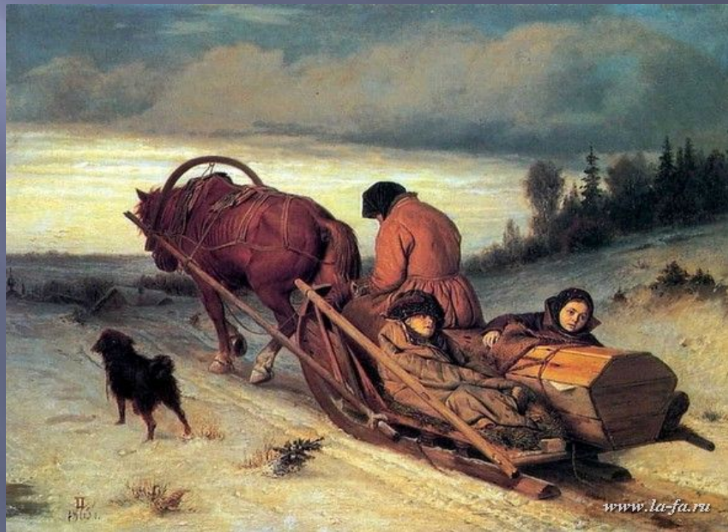
В.Г.Перов. Проводы покойника.

Старуха в больших рукавицах Савраску сошла понукать. Сосульки у ней на ресницах, С морозу - должно полагать.