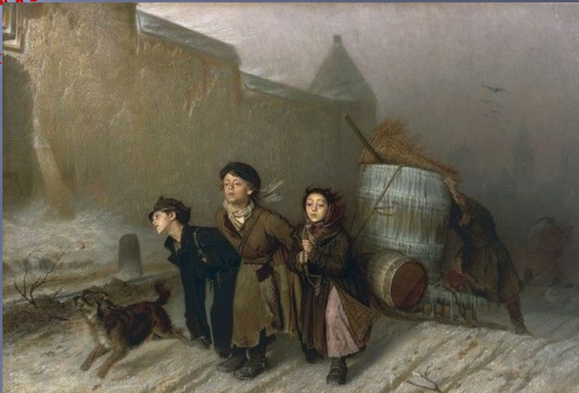
В.Г.Перов . Тройка.