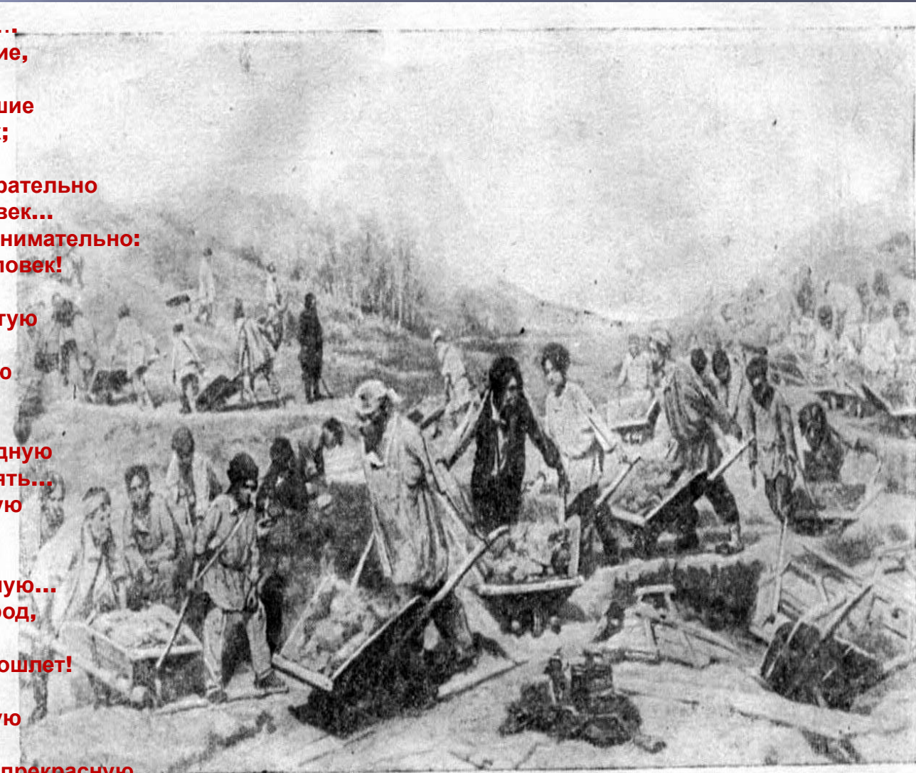
Ремонтные работы на железной дороге. С картины художника К. А. Савицкого,

Вынесет всё - и широкую, ясную Грудью дорогу проложит себе. Жаль только - жить в эту пору прекрасную Уж не придется - ни мне, ни тебе.