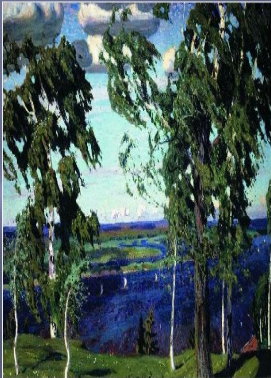
Рылов А. А. Зеленый шум. 1904

Идет-гудет Зеленый Шум, Зеленый Шум, весенний шум! Играючи расходится Вдруг ветер верховой: Качнет кусты ольховые, Подымет пыль цветочную, Как облако: всё зелено: И воздух и вода! Идет-гудет Зеленый Шум, Зеленый Шум, весенний шум