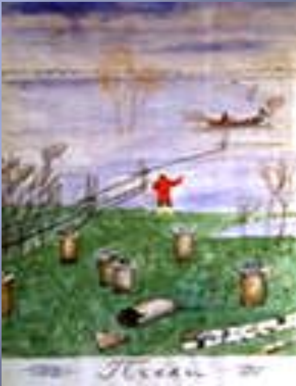
Иллюстрация к стихотворению «Пчелы» Н.А. Некрасова. 1921г. Кустодиев

"Натко медку! с караваем покушай, Притчу про пчелок послушай! Нынче не в меру вода разлилась, Думали, просто идет наводнение, Только и сухо, что наше селение По огороды, где ульи у нас. Пчелка осталась водой окруженная, Видит и лес, и луга вдалеке, Ну и летит, - ничего налегке, А как назад полетит нагруженная, Сил не хватает у милой. Беда! Пчелами вся запестрела вода, Тонут работницы, тонут сердечные! Горю помочь мы не чаяли, грешные, Не догадаться самим бы вовек! Да нанесло человека хорошего, Под благовещенье помнишь прохожего? Он надоумил, христов человек! Слушай, сынок, как мы пчелок избавили: Я при прохожем тужил-тосковал; "Вы бы им до суши вежи поставили", - Это он слово сказал! Веришь: чуть первую вежу зеленую На воду вывезли, стали втыкать, Поняли пчелки сноровку мудреную: Так и валят и валят отдыхать!