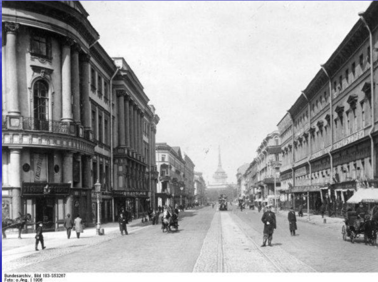
Bild 183-S53267 1906