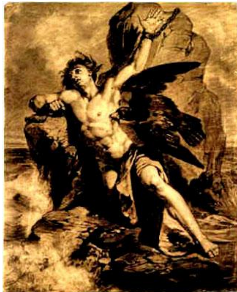
Автор неизвестен Прометей прикованный