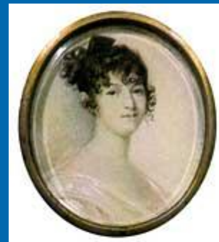
Мать, Надежда Осиповна Пушкина (1775-1836г.)