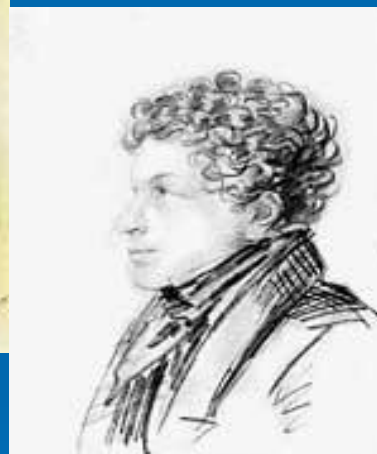
Брат, Лев Сергеевич Пушкин (1805-1852г.)