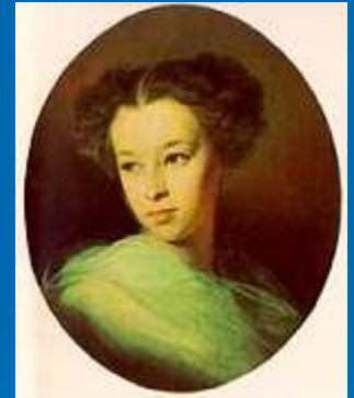
Младшая дочь, Наталья Александровна Пушкина (1836-1913г.) Получила