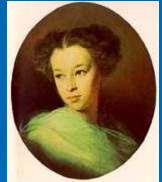
Младшая дочь, Наталья Александровна Пушкина (1836-1913 г.) Получила