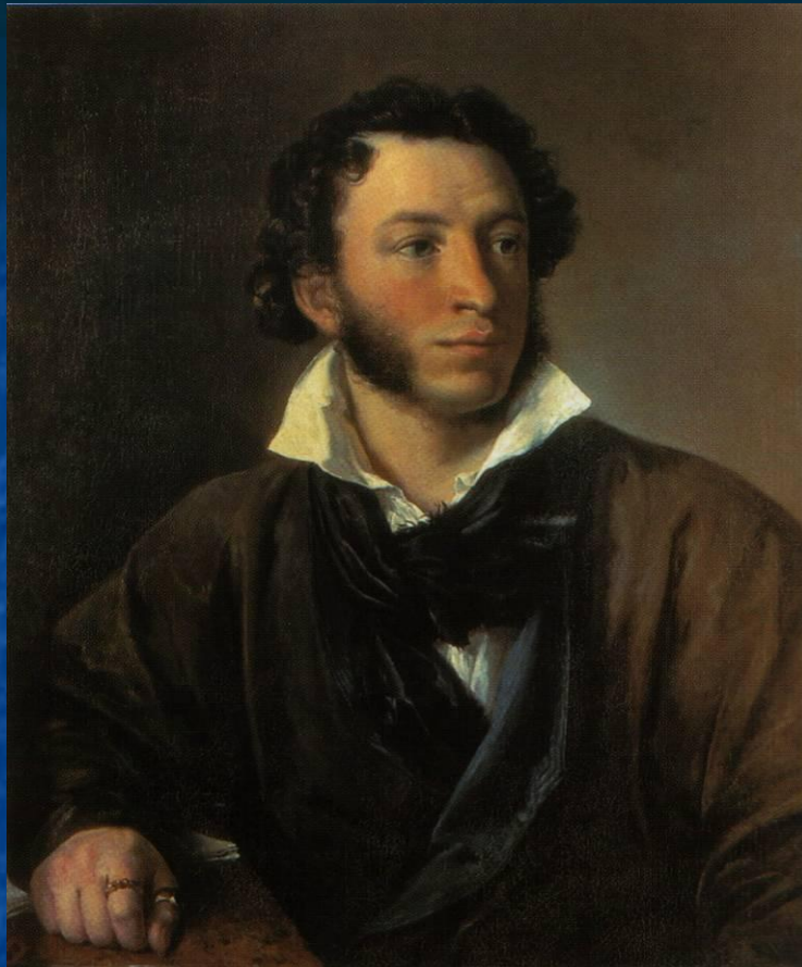
А. С. Пушкин (1799—1837)

Александр Сергеевич Пушкин родился в Москве. С раннего возраста Пушкин воспитывался в литературной среде. Отец его был, ценителем литературы, имел большую библиотеку, дядя был поэтом.