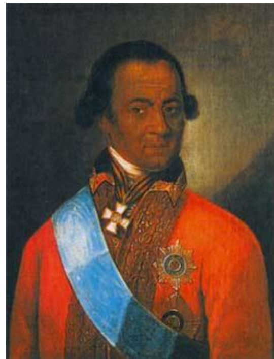
Прадед Александра Сергеевича — знаменитый «арап» Ибрагим (Абрам) Ганнибал, крестник Петра Великого.

Мать поэта, Надежда Осиповна, была внучкой знаменитого Ибрагима Ганнибала.