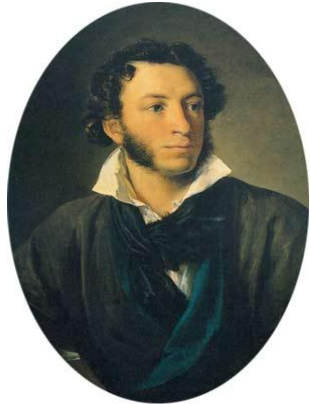
А.С.Пушкин. Портрет работы В. А.Тропинина. 1827 г.

Александр Сергеевич Пушкин.... Это имя сопровождает нас ВСЮ ЖИЗНЬ.