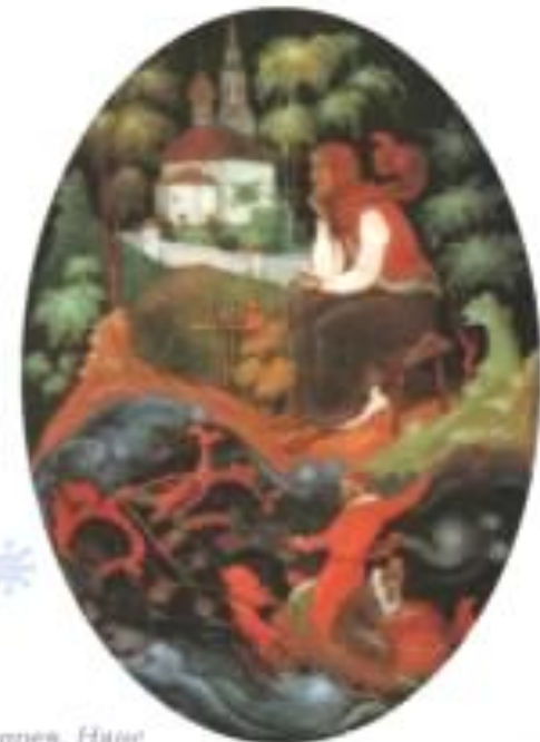
К. Бокшнев. Няне