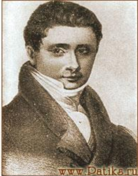
Н. И. Тургенев. Гравюра с рисунка Н. Мартоса. 1811 г.