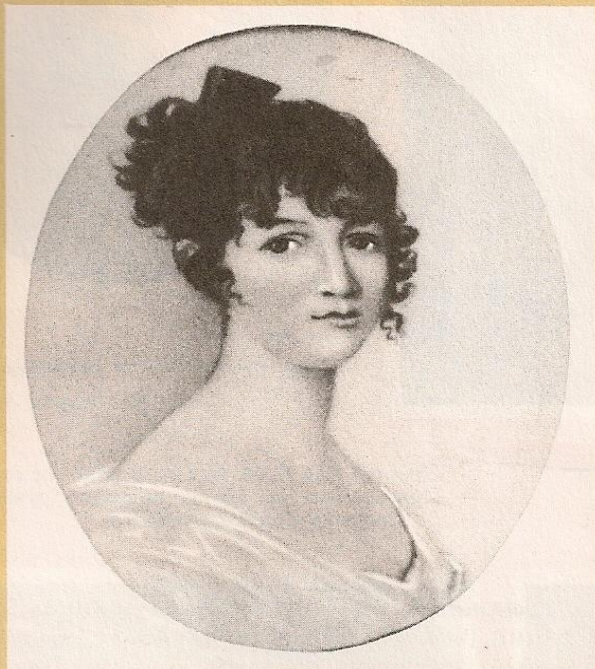
Н. О. ПУШКИНА Ксавье де Местр. Миниатюра. 1810-е гг.