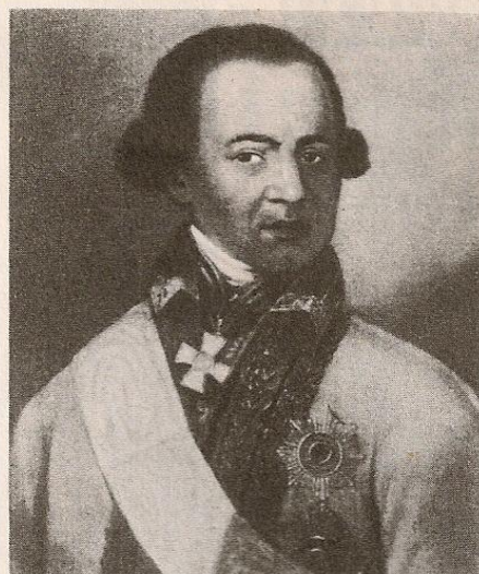
А. П. ГАННИБАЛ Неизвестный художник. Масло. Вторая половина XVIII в.