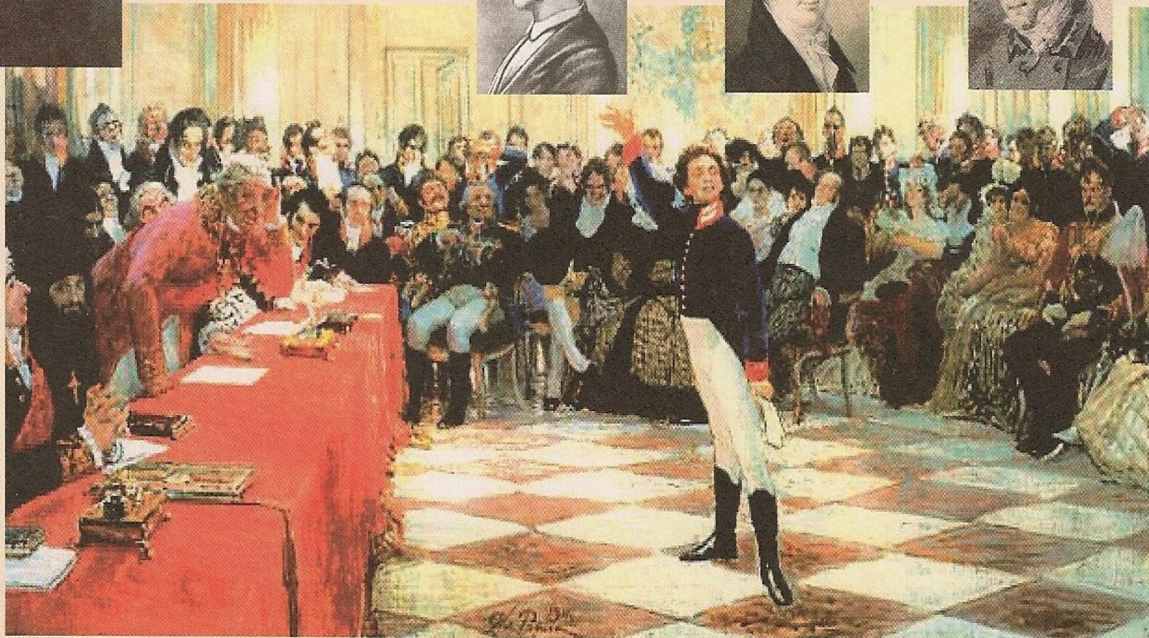
«А. С. Пушкин на акте в Лицее 8 января 1815 года» — «Старик-Державин нас заметил....». Художник И.Е. Репин. 1911 г.