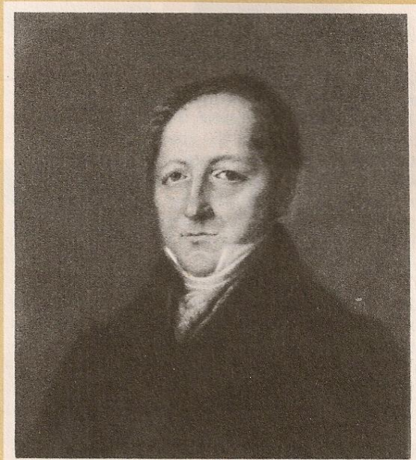
С. Л. ПУШКИН Неизвестный художник. Пастель. 1830-е гг.