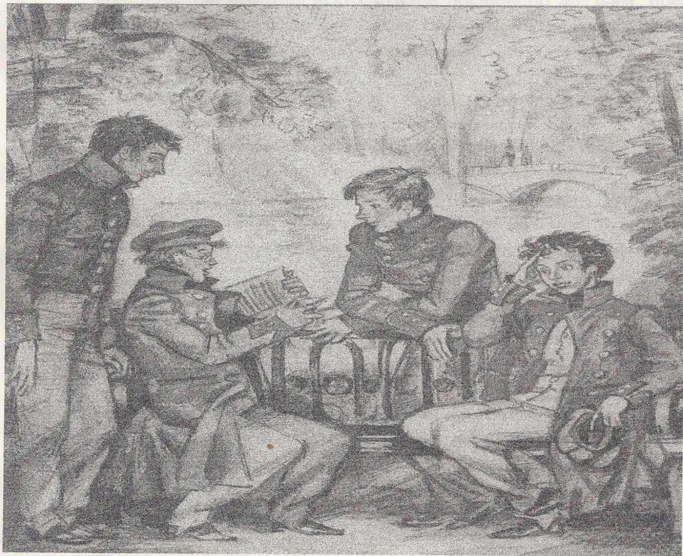
Лицеисты: В. Кюхельбекер, А. Дельвиг, И. Пущин, А. Пушкин.