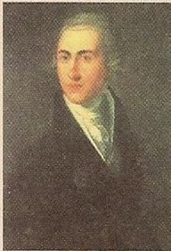
Первый директор Царскосельского лицея — Василий Фёдорович Малиновский. Неизвестный художник. 1790-е гг.