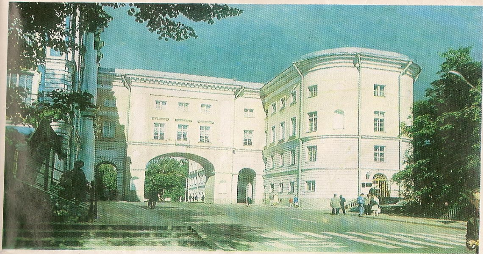
Лицей. Архитектор И. Неелов. 1789—1791 гг. The Lyceum. Architect I. Neyelov. 1789—91

Когда Пушкину минуло 12 лет, был открыт в Царском Селе, что под Петербургом, первый в России лицей. Тридцать лучших мальчиков перешагнули порог заведения.